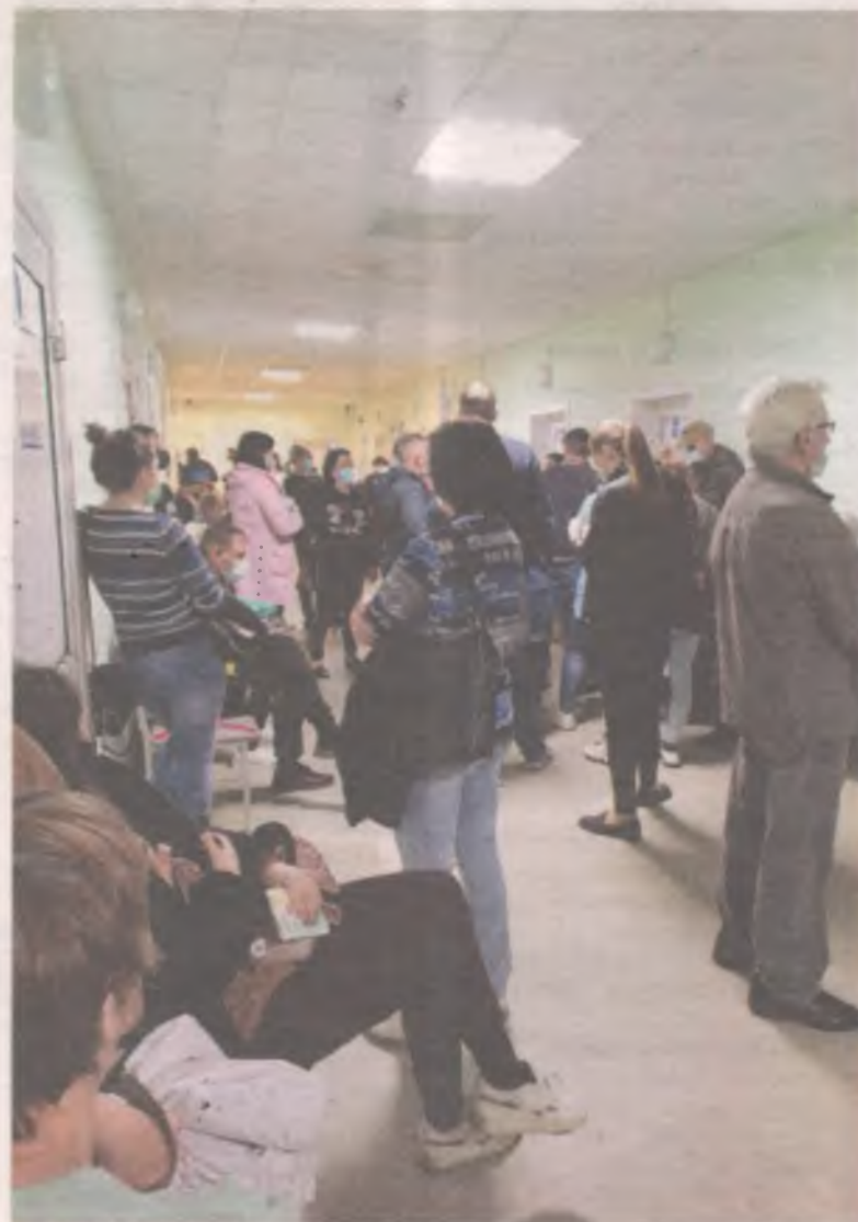
■ В поликлиниках сейчас всюду очереди, и самые длинные - на ПЦР-тест на ковид.

- Готовы выстроить процесс так, чтобы все, кто работает, могли поставить прививку по месту работы. Малый и средний бизнес через уполномоченного по правам предпринимателей могут подавать заявки на коллективные вакцинации. Медики будут выезжать.