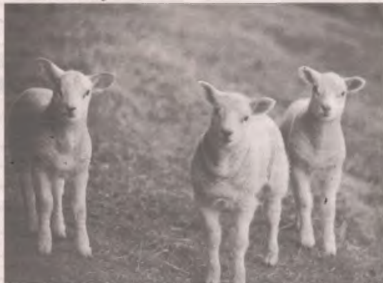
■ Молчание не всегда золото.

Анна КОКОУРОВА, фото с сайта comicvine. gamespot.com