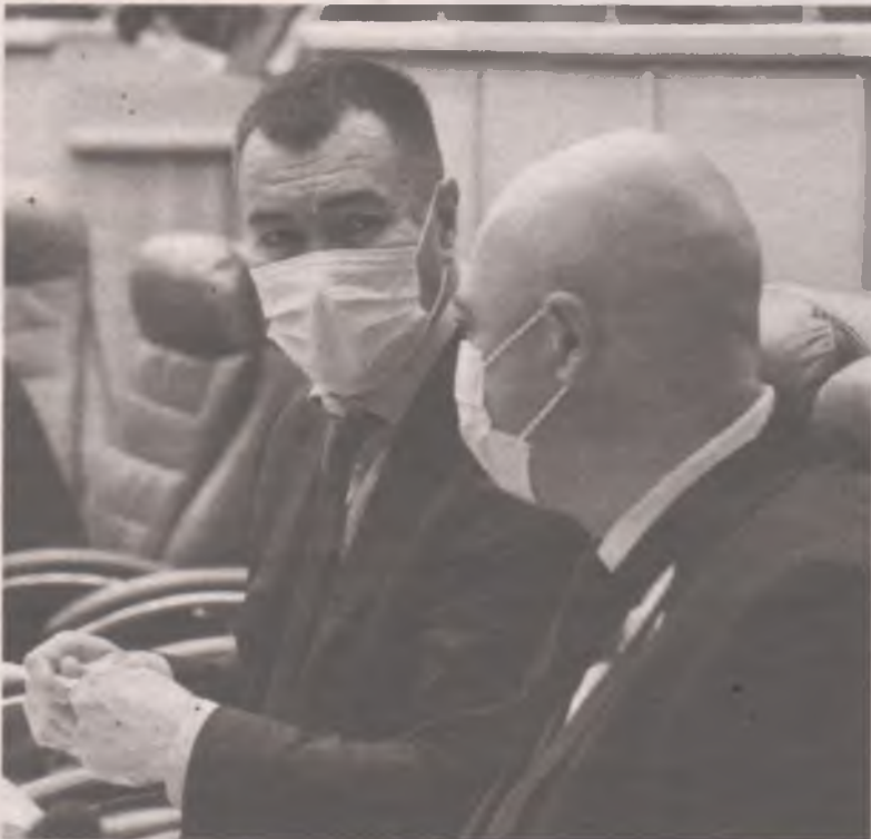
■ В первом чтении приняты изменения на получение звания «Ветеран труда Иркутской области».

Продолжаю публикацию своих отчетов о работе в Законодательном собрании Иркутской области.