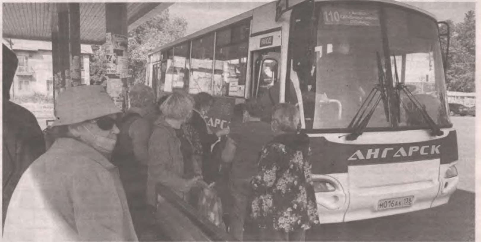
■ Чем меньше автобусов, тем больше толкучки. И шансов заразиться.

...Мы верим Сергею Валерьевичу. Не раз уже такое проходили. В новой истории Ангарска (с тех пор, как по городу стали ходить автобусы одного стиля,