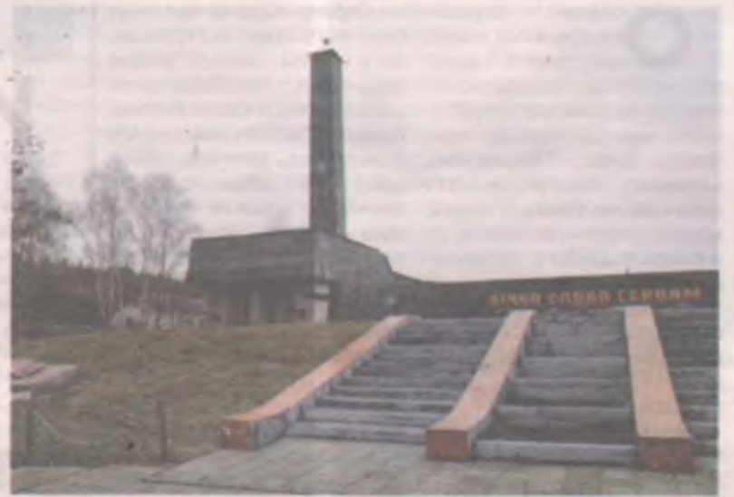
■ Мемориал в г. Радивилов Ровенской области на Украине.

Анастасия МАМОНТОВА