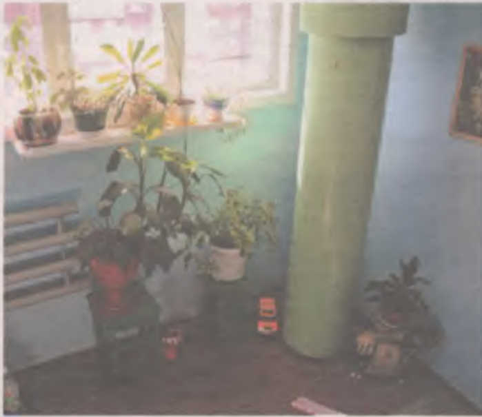
Состояние подъезда зависит не только от управляющей компании, но и от жильцов.

Так как косметический ремонт подъезда не входит в минимальный перечень работ (постановление правительства № 290) и если эта услуга не предусмотрена договором управления, ее стоимость нужно закладывать в тариф дополнительно или увеличивать плату за текущий ремонт. При низкой стоимости этой услуги дом, якобы, не набирает достаточно средств, которых бы