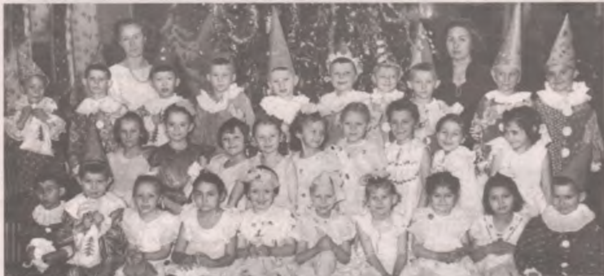
■ 1960 год. Ёлка в детском саду № 1.