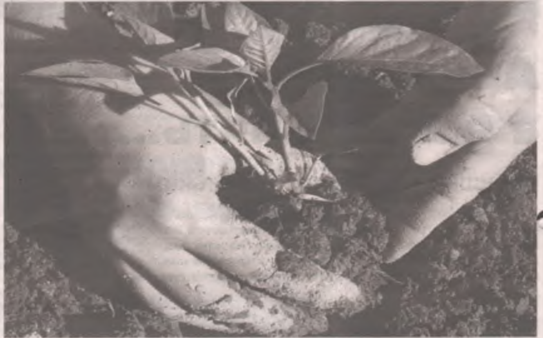
■ Перец вместе с комом земли помещаем в лунку, не заглубляя, корневая шейка должна быть на уровне земли.

Обязательно нужна подсветка. Некоторые садоводы сеют перец в ранние сроки