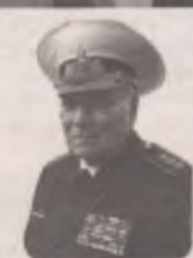
Адмирал КОМАРИЦЫН А.А.