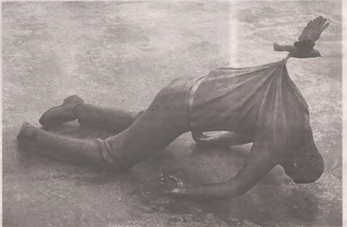
■ Норвегия. Город Берген. Памятник «Не падай духом!». Маленькая и упорная птичка надежды.

Какой бы сильной, активной ты ни была, без поддержки семьи не обойтись. Одной тяжело. Не стоит скрывать от близких диагноз.