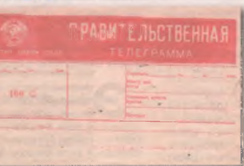
■ На такой бланк наклеивались ленточки с текстом для исполкома или горкома партии. Доставлялась такая телеграмма в течение получаса.

Пресса в те годы стоила копейки. «Знамя коммунизма» - 2 копейки, центральные газеты - 3 копейки,