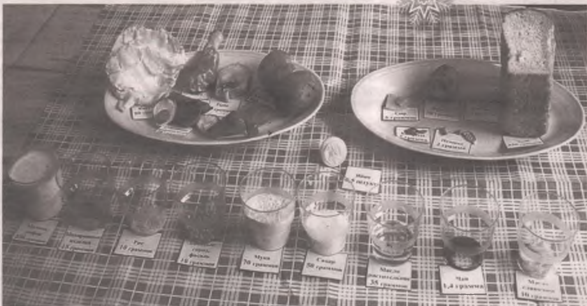
■ Много есть вредно, особенно в пожилом возрасте. Видимо, именно эта мысль легла в основу российского прожиточного минимума для пенсионера.