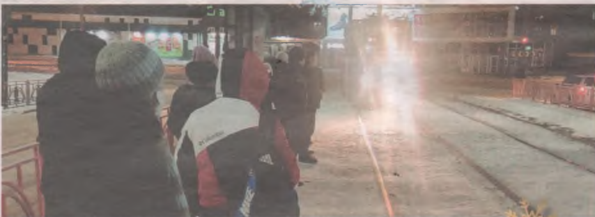
■ 18 декабря, 7.20, остановка «Улица Коминтерна»