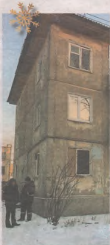
■ Домов серии 1-335с в Ангарске около 500.

Ведь именно они, советские быстрозводимые хрущевки, помогли нашим мамам и папам, дедушкам и бабушкам выбраться из коммуналок и получить свое жилье. Наконец-то, начать жить отдельно в СВОЕЙ квартире. Возможно, именно благодаря этим квартиркам в панельках у них началась полноценная личная жизнь и появились мы с вами, целые поколения ангарчан!