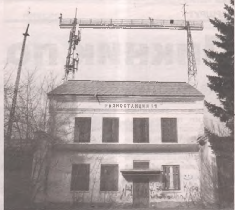
■ Та самая радиостанция, на которой держали связь с Юрием ГАГАРИНЫМ, сегодня испорчена скабрзными надписями на фасаде.