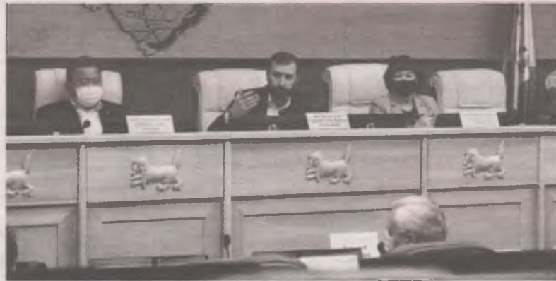
■ Депутаты Законодательного собрания Иркутской области готовы обсудить любые меры, которые помогут бизнесу выжить в пандемию.