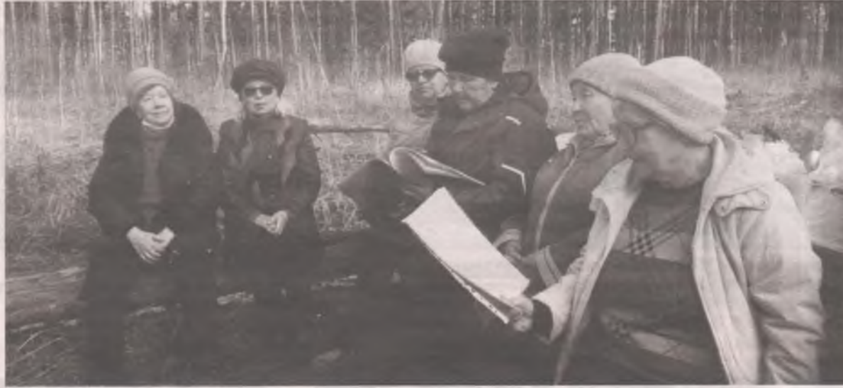
После обеда на свежем воздухе нормализуется сон и успокаиваются нервы.

В этом месте, в пяти километрах от Усоля, на территории Тельминского муниципального образования, из земли бьет источник, вода в котором никогда