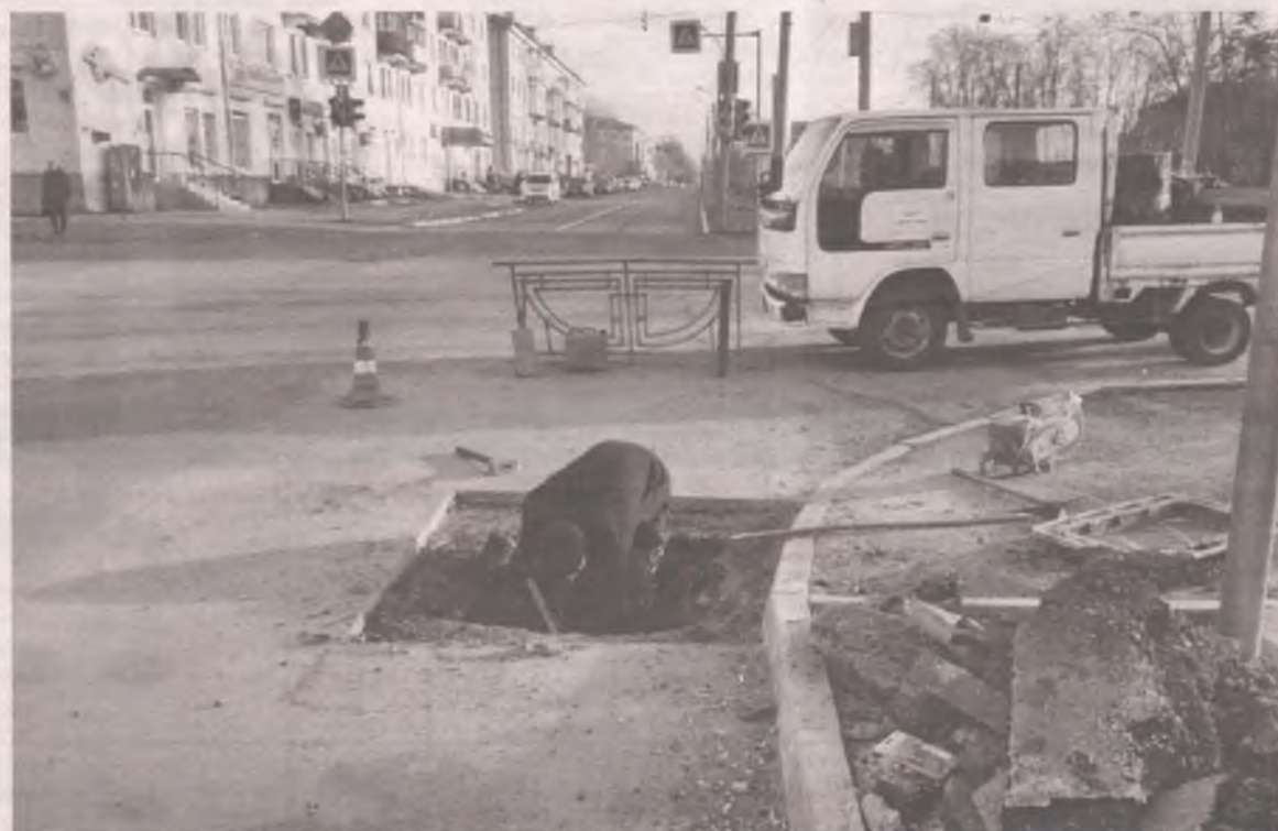
■ За некачественную работу подрядчик отвечает штрафами и устраняет брак.