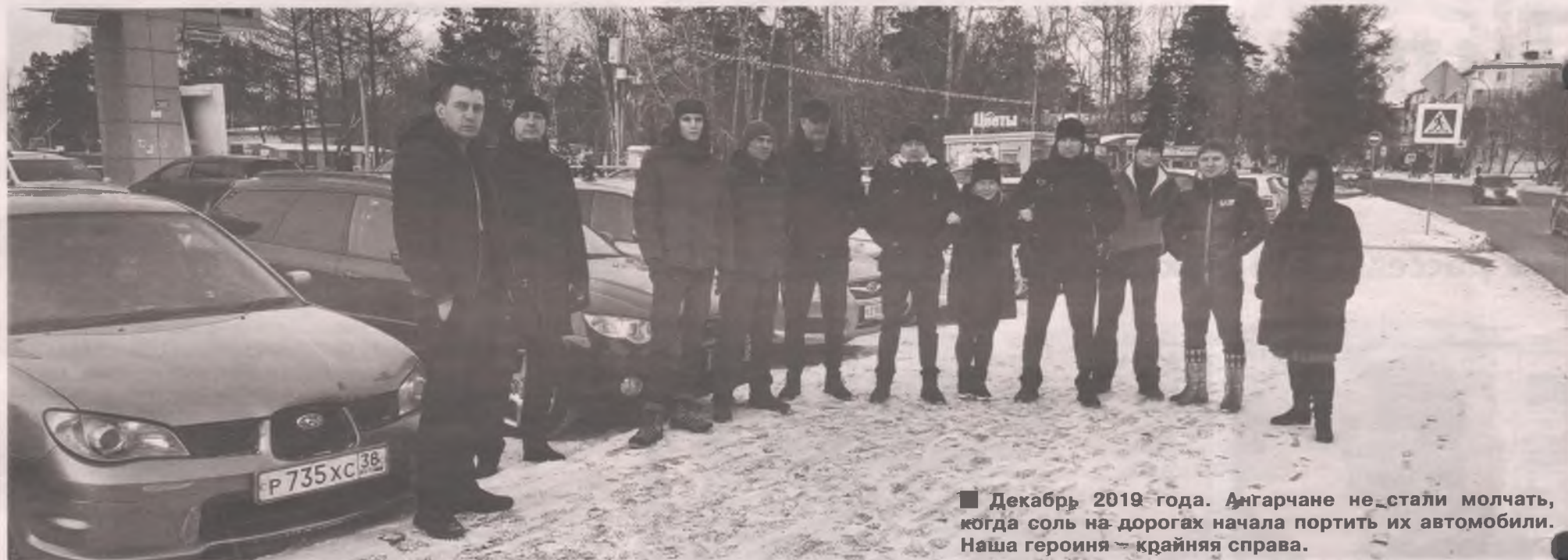
■ Декабрь 2019 года. Ангарчане не стали молчать, когда соль на дорогах начала портить их автомобили. Наша героиня — крайняя справа.