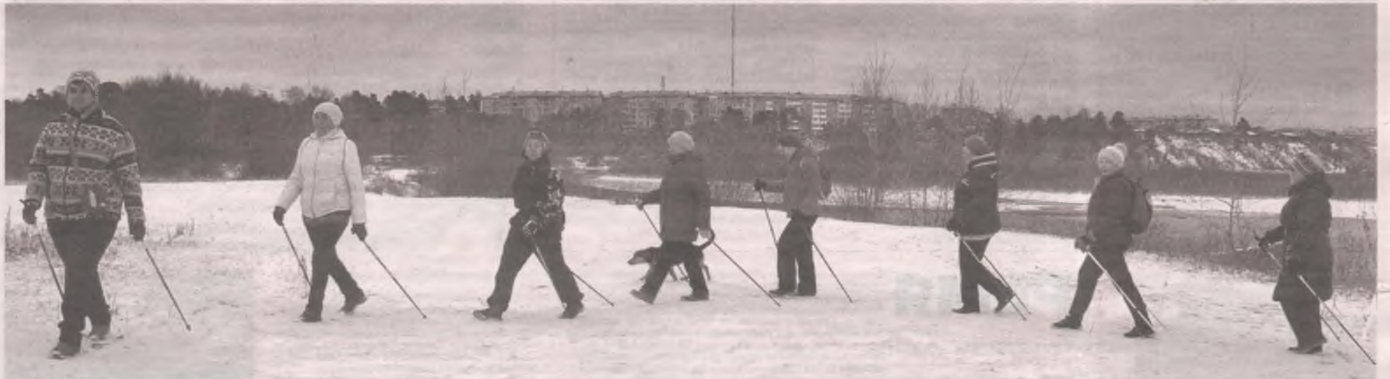
У людей, регулярно занимающихся скандинавской ходьбой, инсульты случаются реже, чем у тех, кто ездит в автобусах и лежит на диване.

✓ Двигайтесь! Доказано, что у физически активных людей и мозги подвижны. Освойте нейробику - зарядку для мозга. Ходите по квартире с закрытыми глазами, чистите зубы и причёсывайтесь левой рукой, почаще меняйте привычные маршруты - это помогает включить мало задействованные участки мозга и укрепляет связи между полушариями.