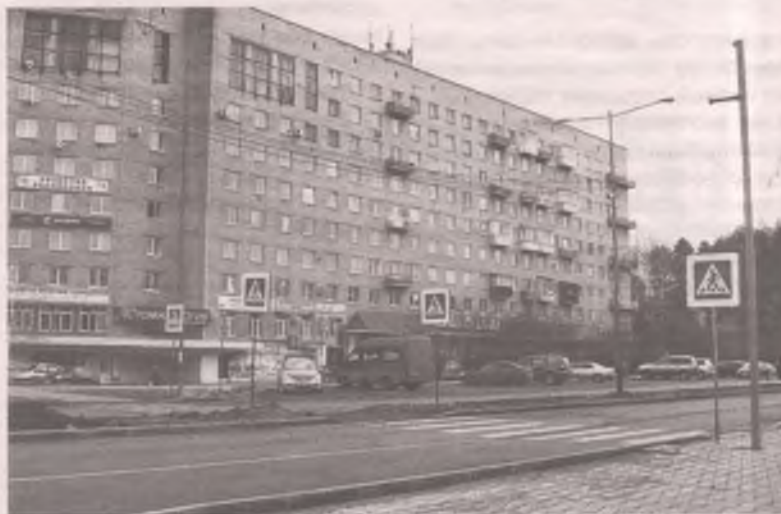
■ Пешеходный переход, который расположен не там, где надо.

маю, что таких пенсионеров в городе много. Пенсия маленькая, всё дорожает с каждым днём, а тут ещё плату за проезд увеличили. И не на рубль хотя бы, а сразу на пять! А есть ещё многодетные, малоимущие семьи. Им что делать? Пешком ходить?