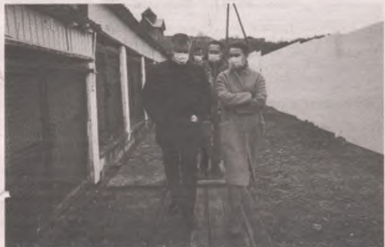
■ Губернатор лично проверил, в каких условиях содержатся животные в приюте.