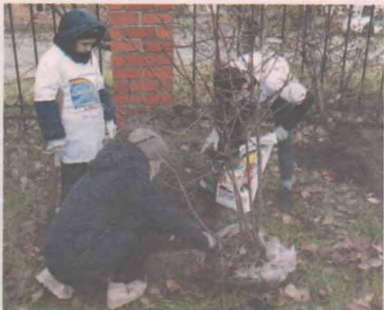
Волонтеры фонда «Семьи - детям» второй год высаживают деревья в подарок почетным гражданам Ангарска.