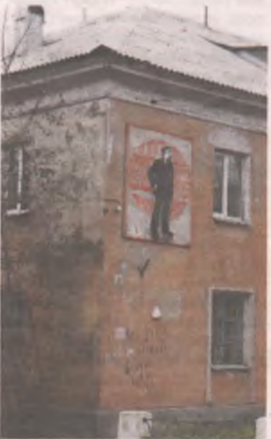
Откуда взялся Ленин на доме № 15 - загадка.