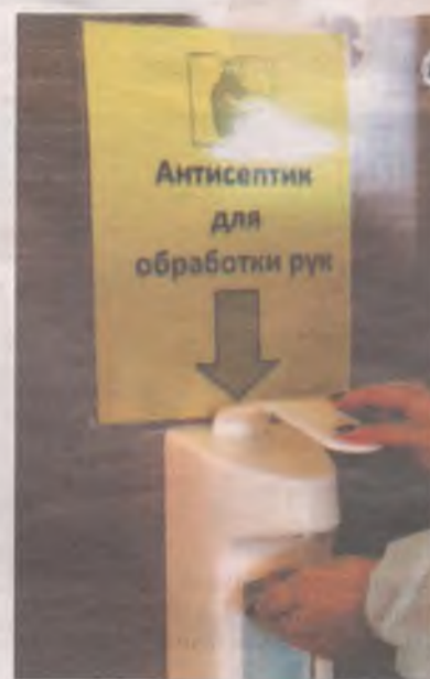
Чтобы не заразиться, мойте руки не только перед едой, а при каждом удобном случае.

Должностных лиц за несоблюдение указа губернатора могут оштрафовать на сумму от 10 до 50 тысяч рублей, предпринимателей без образования юридического лица - от 30 до 50 тысяч рублей, юридических лиц - от 100 до 300 тысяч рублей. За повторные нарушения грозит штраф до миллиона рублей и приостановление деятельности до 90 суток.