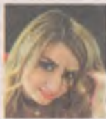
Ольга РЫБНИКОВА, фотограф:

- Щенка, любого. Гладишь этот милый комочек, и тепло на душе становится. В детстве не разрешали заводить собаку. Сейчас у меня большая семья: я, муж и трое детей, самой младшей дочке недавно годик исполнился, внимания для щенка не хватит.