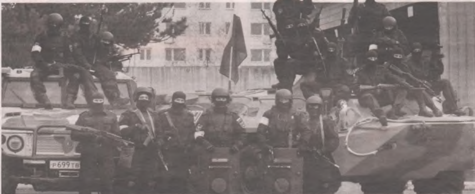
■ Отряд Ангарского ОМОНа. В целях безопасности лицо героя мы не можем показывать. Только в балаклаве - специальной шапке-маске. Он здесь среди коллег.

С 2016 года ОМОН стал подразделением Росгвардии. Бойцы отряда особого мобильного назначения не участвуют в расследовании преступлений. ОМОН вызыва-