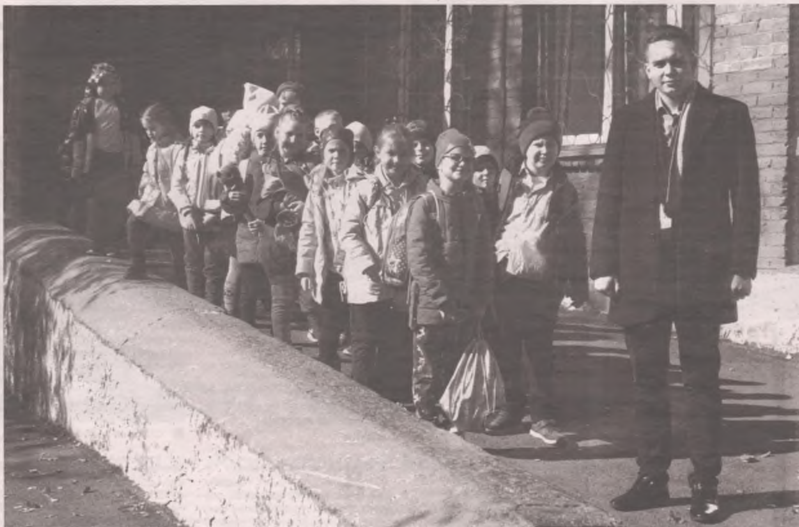
■ Первую учительницу часто называют второй мамой. Теперь от этого стереотипа пора отказаться.