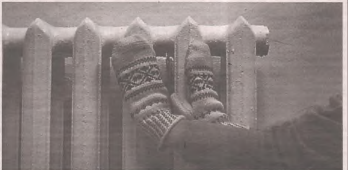
Допустимая продолжительность перерыва отопления составляет не более 24 часов в течение месяца.