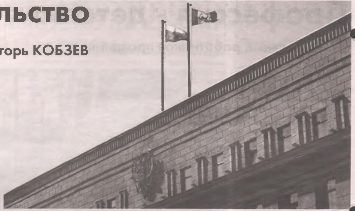
■ Все должностные лица в правительстве перестали быть «и.о.».