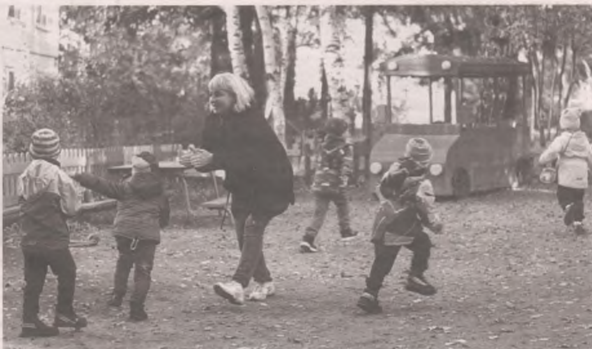
■ Воспитатель - профессия не офисная. Тихо не посидишь.

Да, мы знаем, что вам непросто. Ведь для нас не секрет ваши зарплаты. Разве справедливо платить не самые большие деньги