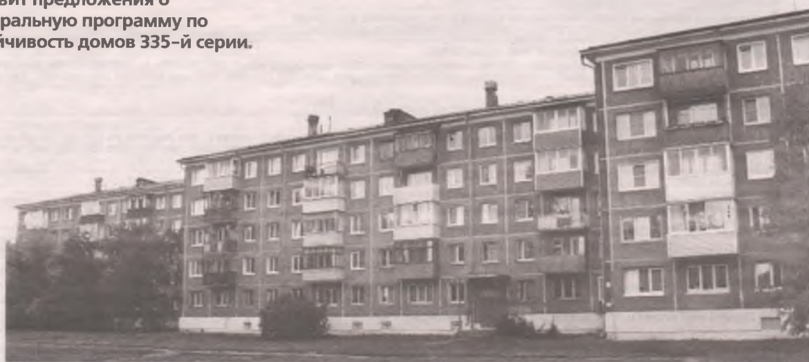
■ Теоретически сейсмодифицит в домах 335-й серии составляет 2 балла. Однако точные данные появятся только после обследования дома на Восточной.

Также губернатор намерен инициировать на заседании правительственной комиссии вопрос о создании в Иркутской об-