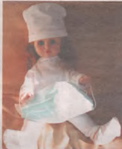
■ Вирус добрался и до детей, и до спортсменов. Не забывайте носить маски.

Что касается учреждений дополнительного образования, то они продолжают работать дистанционно. Исключение сделано только для организаций, у которых есть большие площади и они могут организовать