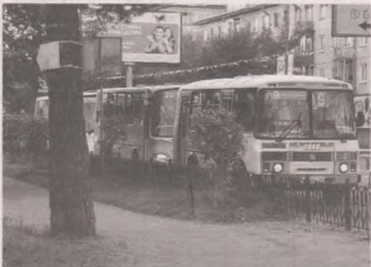
■ Ещё одна причина скопления автобусов – долгие сигналы светофора.

Анастасия ТЮЛЬПАНОВА, фото Дарьи БОГДАНОВОЙ