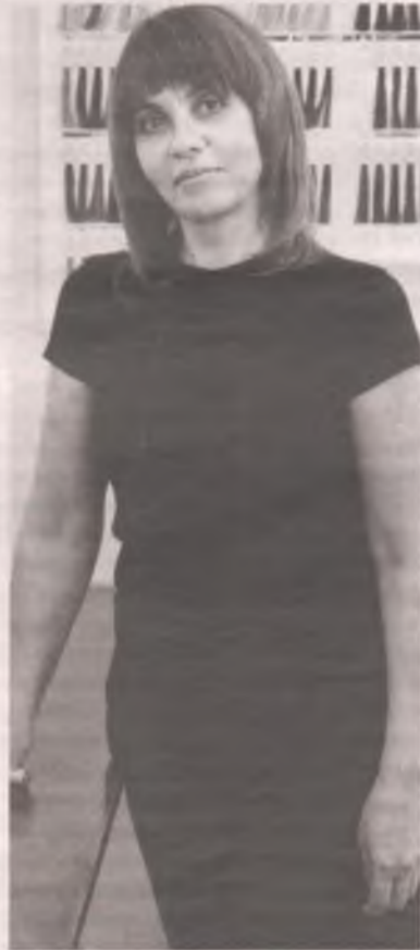
Узнать расписание обучающих курсов можно в Инстаграме центра «Миллениум» instagram.com/millennium.angarsk/

В моде естественность. Я хорошо отношусь к тому, когда мастер рекомендует не красить натуральные волосы, и сама всем говорю: носите свой натуральный цвет, пока позволяет возраст. Под этот