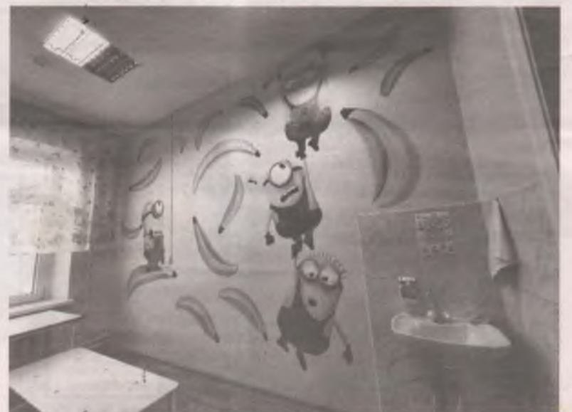
■ Девушки уже оформили палату в Ивано-Матренинской детской больнице.