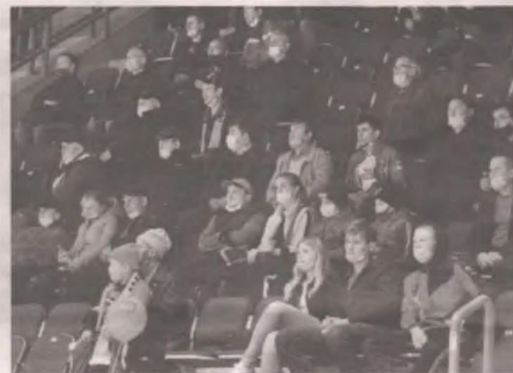
Ходить на игры ангарчане не перестали.

- Билеты продаются через одно кресло, тем самым мы добиваемся соблюдения социальной дистанции, - рассказал нашей газете Роман