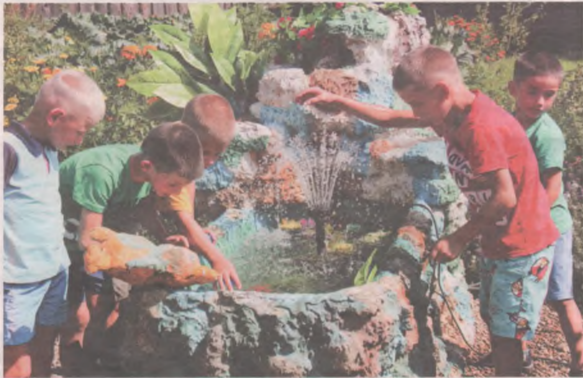
■ Фонтан сделали своими руками. Специально для конкурса. Теперь от него мальчишек не оторвать.