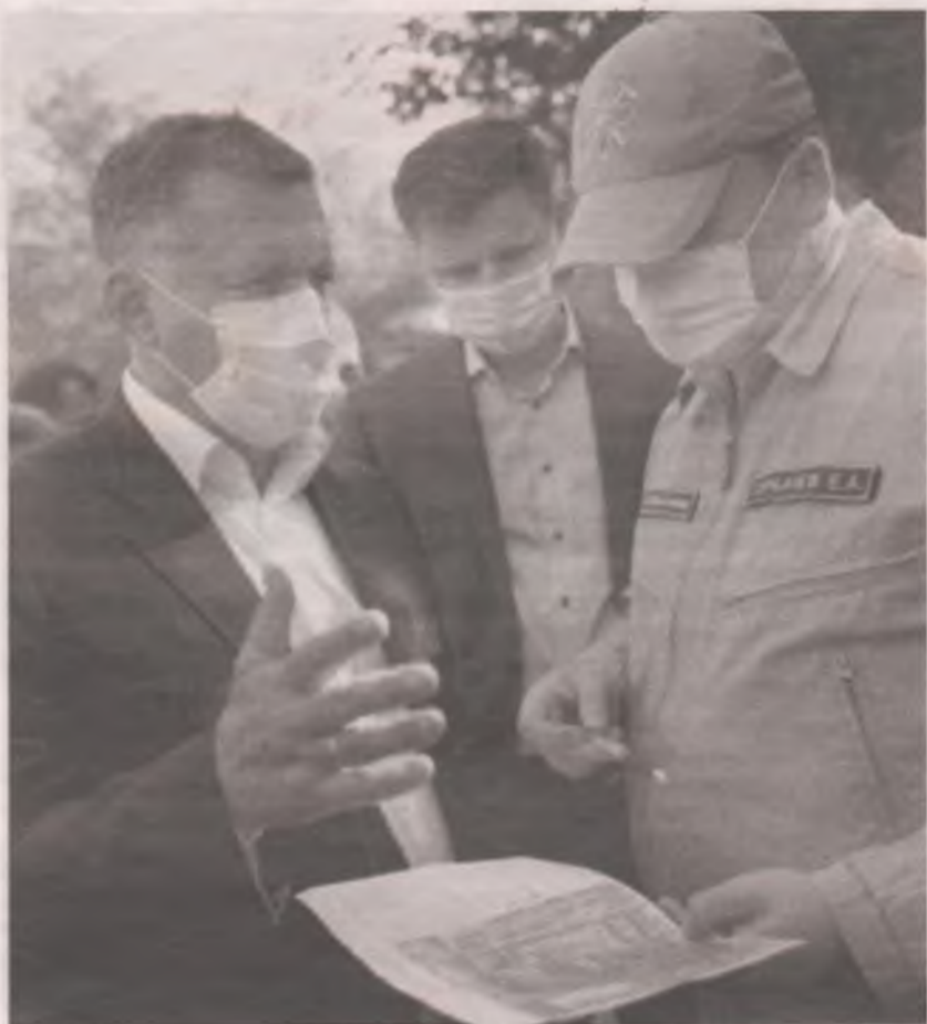
■ На месте будущего Суворовского училища уже побывали специалисты военно-строительной компании Министерства обороны.

Впервые об этом стало известно во время рабочего визита министра обороны РФ – генерала армии Сергея ШОЙГУ, который состоялся 12 августа. Ранее с таким предложением к президенту обратился глава региона Игорь КОБЗЕВ.