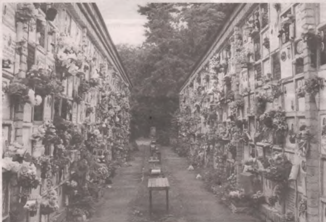
■ Старейший в России колумбарий Донского кладбища Москвы. Здесь начали размещать прах ещё в начале 20-го века.

Колумбарий — это хранилище урн с сожжённым прахом при крематории.