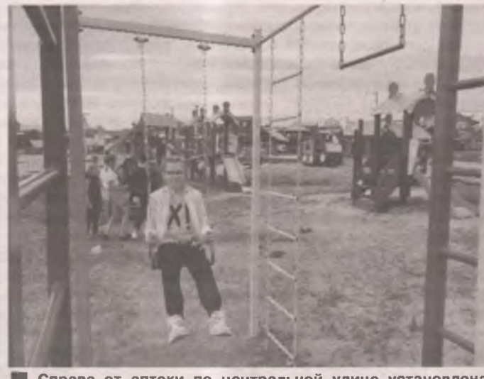
■ Справа от аптеки по центральной улице установлена новая детская площадка.