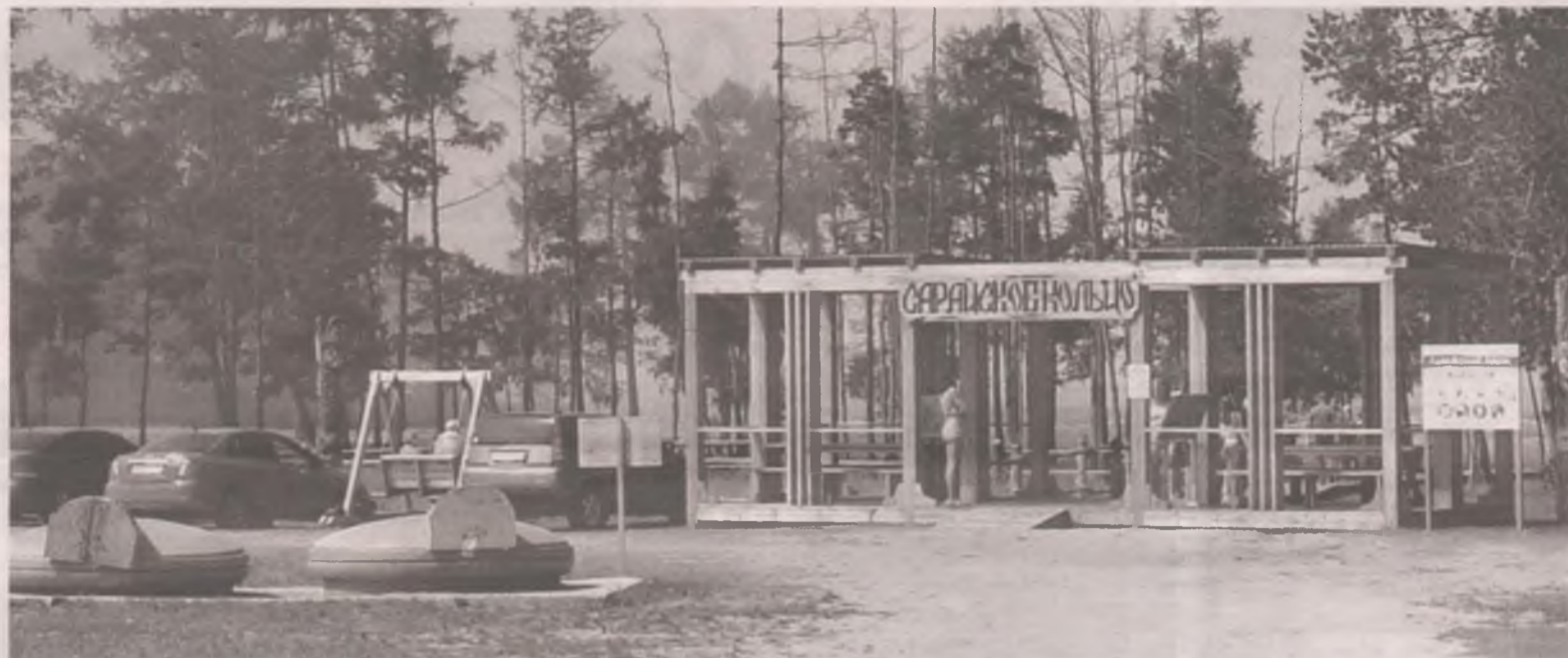
■ Новая входная группа на Сарайский пляж. Слева качели.

На входе в магазины вас ждут такие же, как в городе, объявления: «Наденьте маску! Не обслужим!»