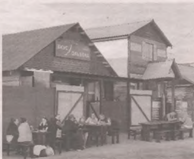
■ Какой бы ни была погода, есть придётся на улице.