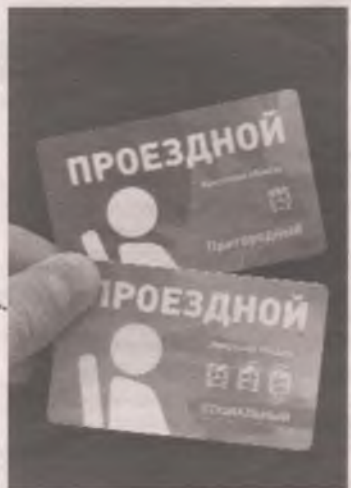
Верхний проездной - синий, даёт право льготного проезда только в пригородном автотранспорте. Нижний - зелёный, городской.

И главное: чем же именно пассажиры этих маршрутов заслужили такое благо - пользоваться зелёным городским ЭСПБ? Ведь каждый дачник мечтает, чтобы зелёная город-