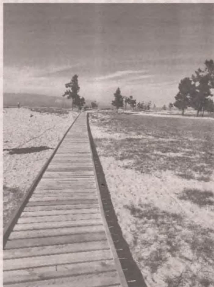
■ Дорожка по пляжу теперь идёт на 1,5 километра.