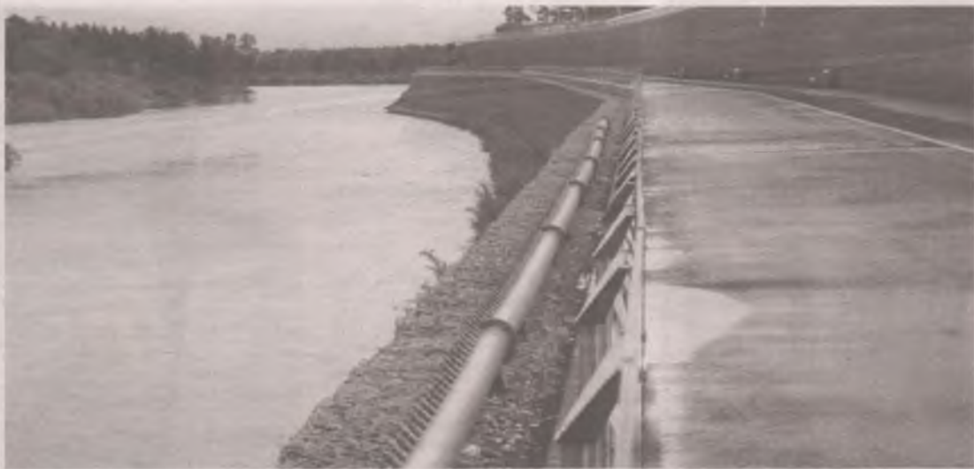
Фонтан на набережной открыли в начале мая. Обещали, что будет работать всё лето.