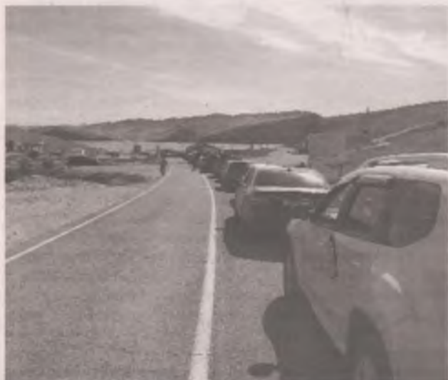
■ Очередь на паром.