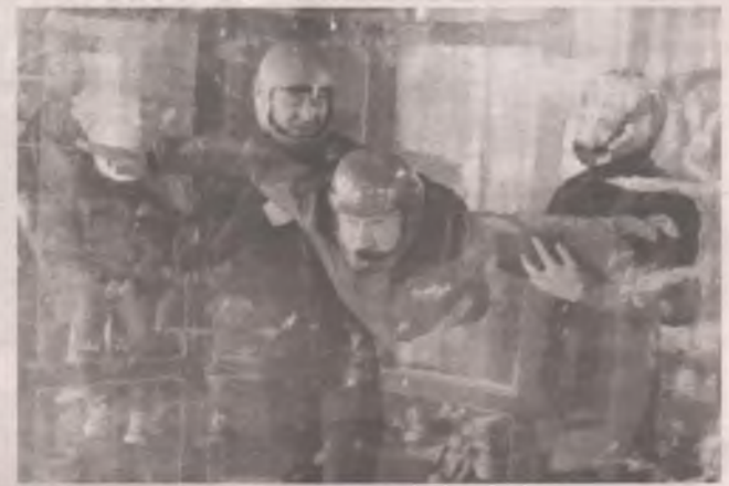
■ И если прямо сейчас тебе тяжело - дай пять. Ты цвётёшь, пробивая асфальт.