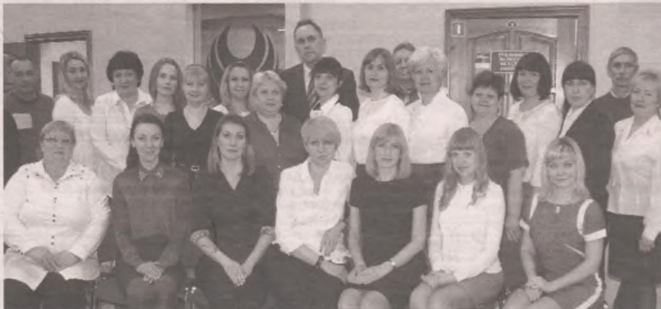
■ Лучший подарок для банкира - благополучие клиентов.