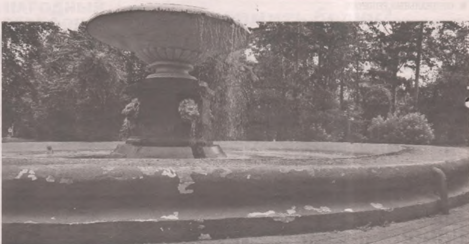
■ Так сейчас выглядит фонтан после ремонта стоимостью в полмиллиона рублей.

- Зачем вы вообще берётесь за этот парк?