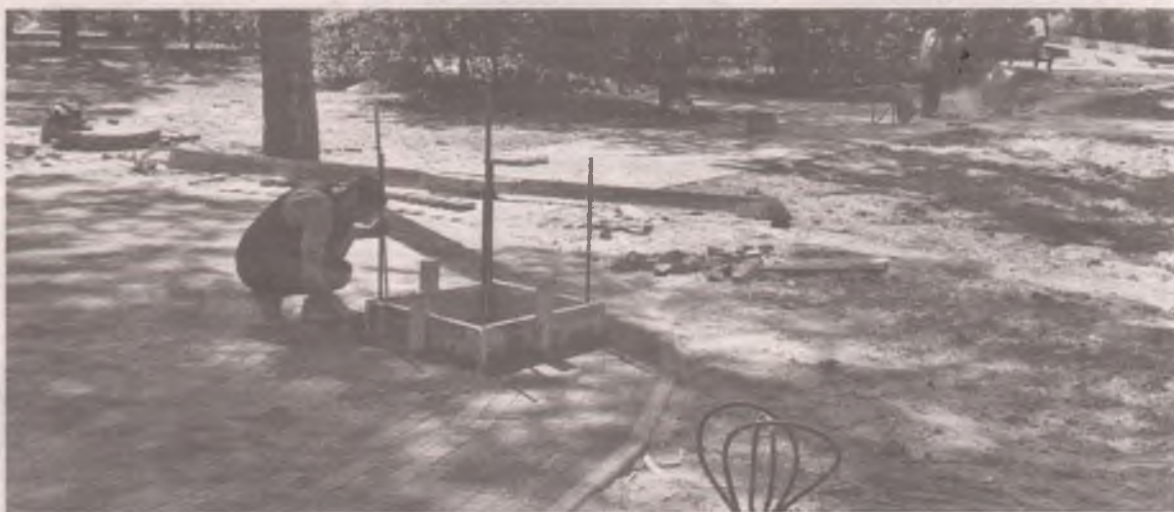
■ Одну плитку заменили на другую. Стоимость работ – 4 миллиона.

Почему всё ремонтируют и строят, а красоты нет?