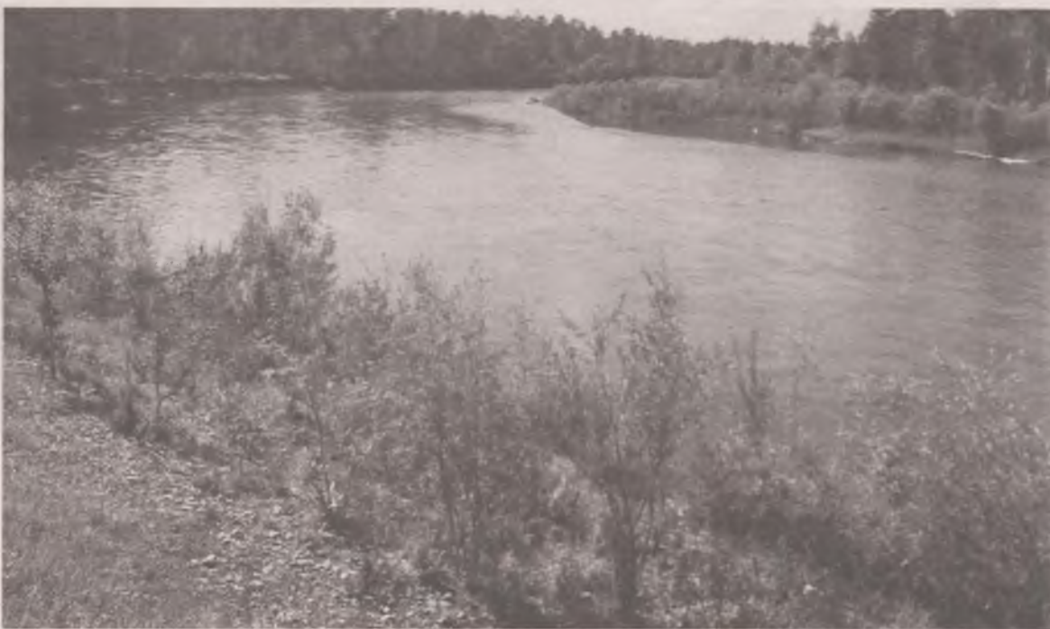
Деревни всегда строили вдоль рек. Раньше воду из них использовали для питья. Сейчас только для хозяйственно-бытовых нужд.

Скоро ангарчане из водопроводных кранов будут пить вкусную воду из артезианской скважины: ту самую, что сейчас покупают в бутылках с названием «Чебогорская». Новый водозабор уже проектируется. А зачем ждать, если можно поехать в Чебогоры прямо сейчас и набрать этой самой вкусной воды?