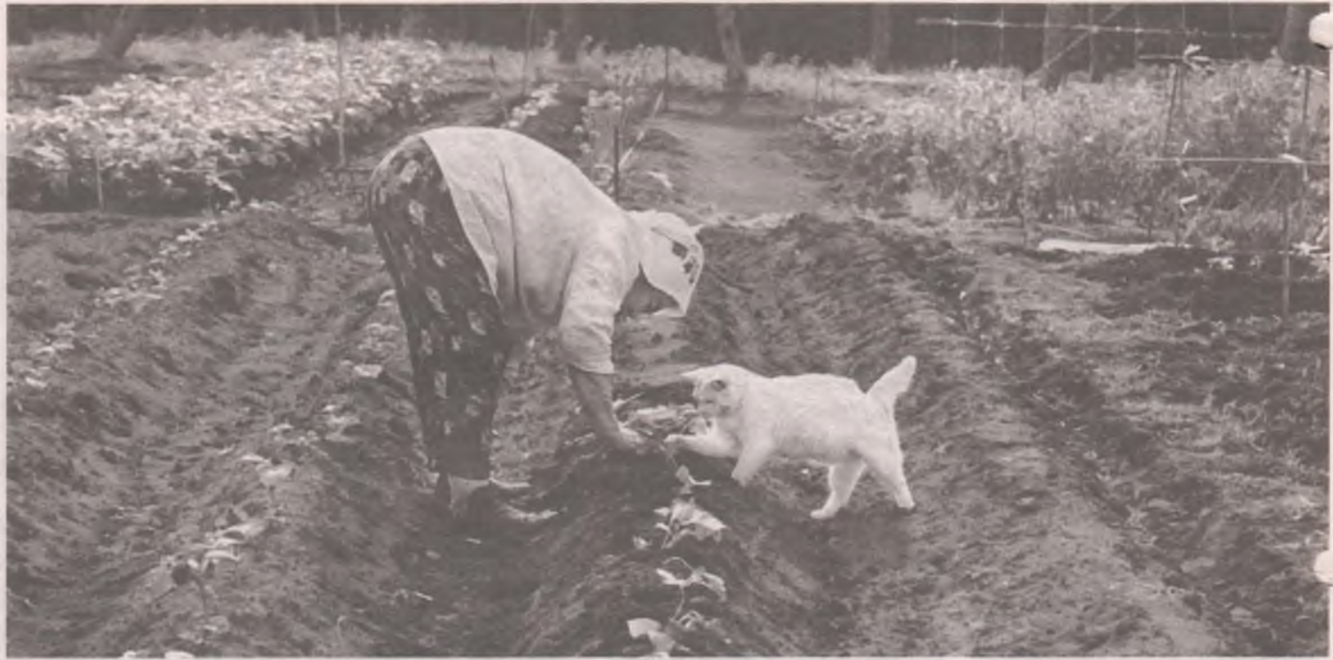
■ Да не так! Давай покажу!

Что надо обязательно посадить этой весной