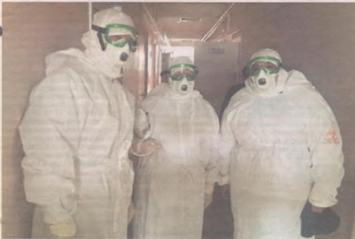
■ Бригады ангарской «скорой помощи» на вызовы с подозрением на коронавирусную инфекцию выезжают в защитных костюмах. На станции работают 30 врачей, 130 фельдшеров, 80 водителей. Ежедневно на вызовы выезжает 19 машин, 2 находятся в резерве.

Как мы пережили ещё одну неделю самоизоляции