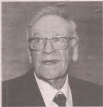
– «КАРМАННЫЙ ДОКТОР» вернул меня к жизни!

Счастье – это быть здоровым. Вы согласны? Ибо без здоровья нет сил радоваться жизни. И даже для счастья в личной и семейной жизни, и успеха в работе нам непременно нужно здоровье! Как обрести его знают те, у кого есть «КАРМАННЫЙ ДОКТОР», творящий настоящее волшебство!