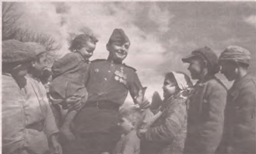
■ Солдат, победивший фашизм, вернулся с войны. Вернулся на разрушенную землю. Всё его имущество поместилось в вещмешке. У его сына нет даже обуви. А через 12 лет мы первыми покорили космос.