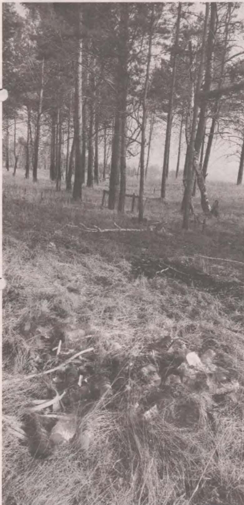
■ Мы нашли прекрасное место для самоизоляции. Но кто-то его нашёл раньше нас.