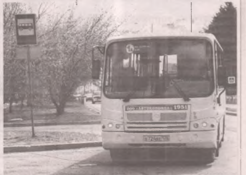
■ Автобус с номером 1А ходит от микрорайона Строитель до БСМП.