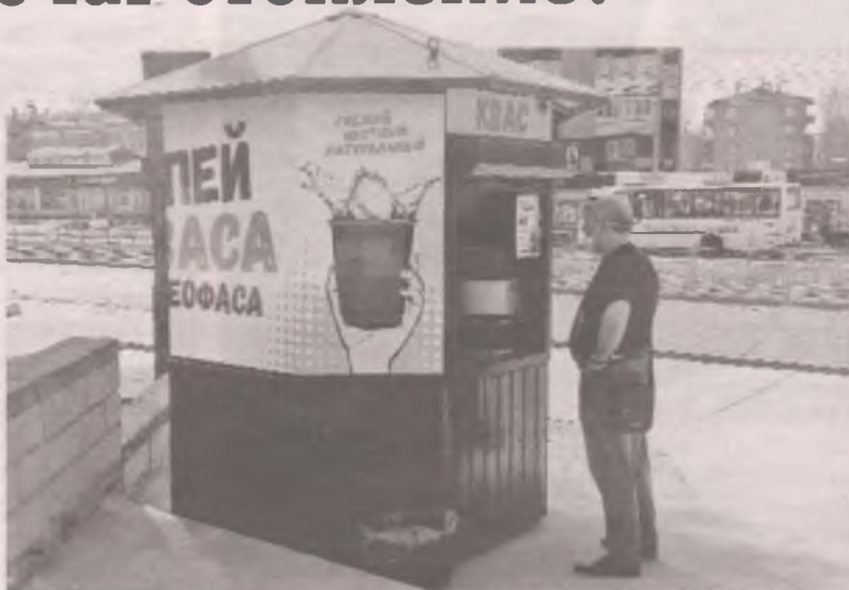
Началась пора борьбы между теми, кому жарко, и теми, кому дует.

Среднемесячная температура мая прогнозируется без аномалий: плюс 8-10 градусов тепла по Цельсию. Ночью температура еще будет опускаться до 0 минус 5 градусов. В соответствии с нормативами завершение отопительного сезона происходит при среднесуточной температуре наружного воздуха выше 8 градусов. Обычно тепле-