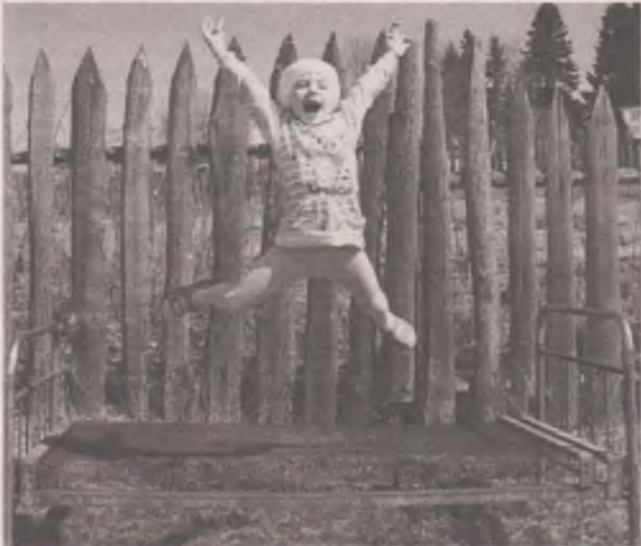
Урал На дачу!