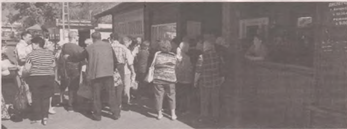
■ 1 сентября 2016 года. Очередная блокировка транспортных карт заставила людей толпиться в пункте выдачи – на автостанции. Единственное предприятие, которое в этот период без проблем возило льготников, – «Автоколонна 1951», выдававшее собственные бумажные проездные.