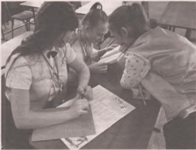
■ Иногда для ответа необходима подсказка. Помог словарь.