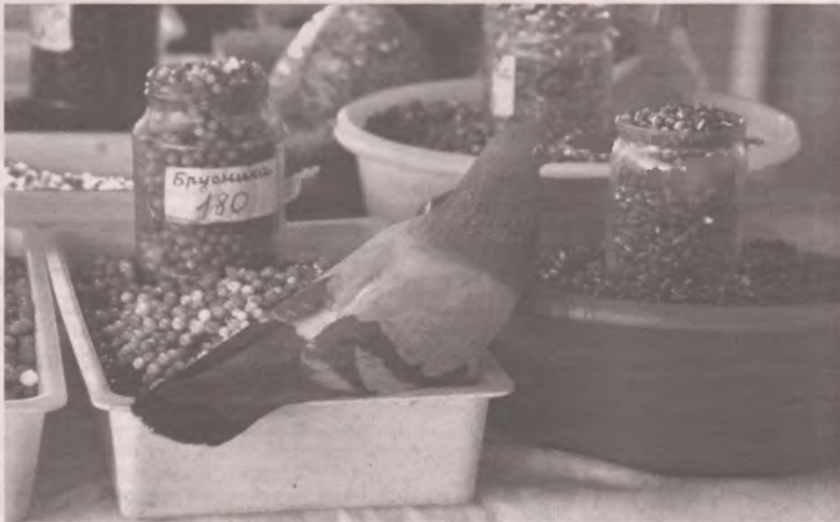
■ Не забывайте, что в пост нам нужны витамины, а также о том, что орехи очень калорийны.

Бобовые. Фасоль, соя, чечевица, чина, нут, горох, маш... Эта категория продуктов содержит в сред-