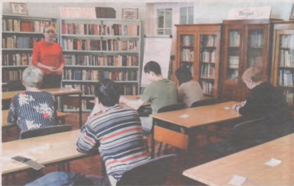
Консультация в библиотеке № 3 им. Леонида БЕСПРОЗВАННОГО.