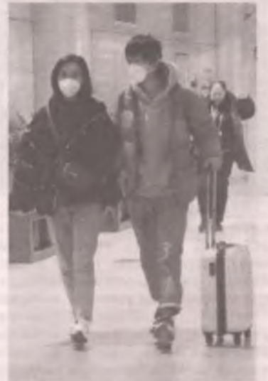
Сейчас туристический бизнес всего мира терпит огромные убытки.

Каждый день ситуация с коронавирусом меняется. И что будет через три месяца, никто не знает. Такой ответ мы получили в территориальном отделе управления Роспотребнадзора в Ангарском городском муниципальном образовании, Шелеховском и Слюдянском районах и по «горячей линии» Министерства здравоохранения Иркутской области 8(3952) 280-326. Кстати, именно по этому номеру могут звонить те, кто вернулся из стран, где зарегистрированы случаи коронавирусной инфекции, и передавать сведения о месте и дате пребывания, возвращения, контактную информацию. Судя по тому, что Всемирная организация здравоохранения на этой неделе объявила пандемию коронавируса в мире, звонить и сообщать на «горячую линию» о своих перемещениях нужно обязательно.