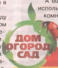
Пенсионерам скидка 10%*

А еще «Крепень» можно использовать для полива комнатных цветов, они тогда больше и дольше цветут, весна ведь на дворе!