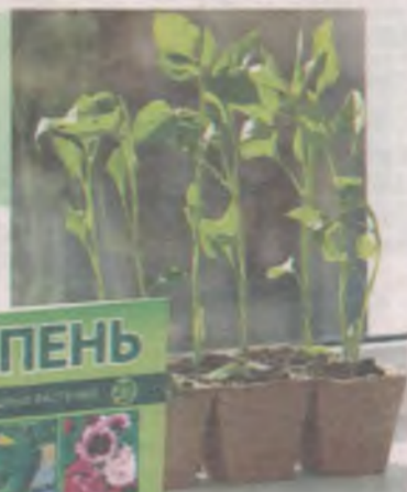
Чтобы рассада не переросла.

Итак, что может сделать БТУ: ускоряет процесс одновременно появления всходов, улучшает приживаемость рассады после пикировки, защищает растения