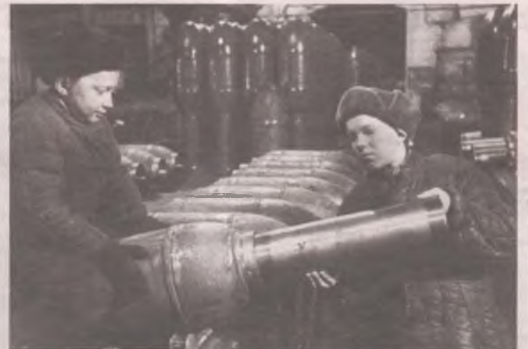
Ежемесячная денежная выплата детям войны с 1 января 2020 года составляет 500 рублей.

2) внеочередной прием в государственных социальных учреждениях Иркутской области, внеочередное оказание медицинской помощи;