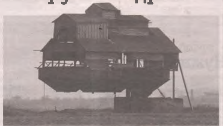
Владельцу недвижимости будет полезно вовремя узнать любую информацию о своём доме.

- Например, сейчас в реестр недвижимости вносится большое количество информации о зонах с особыми условиями использования территории. На земельные участки, попавшие в границы таких зон, накладываются определенные ограничения. При наличии адреса электронной почты управление Росреестра по Иркутской области сможет мгновенно уведомить собственника, что его участок вошел в границы одной из таких