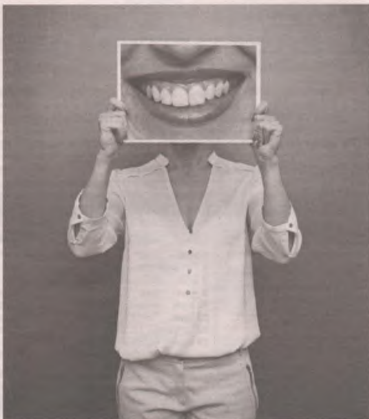
■ Если дорогие не значит хорошие, то зачем платить больше?

Вот топ пять лучших товаров по результатам исследования Роскачества: