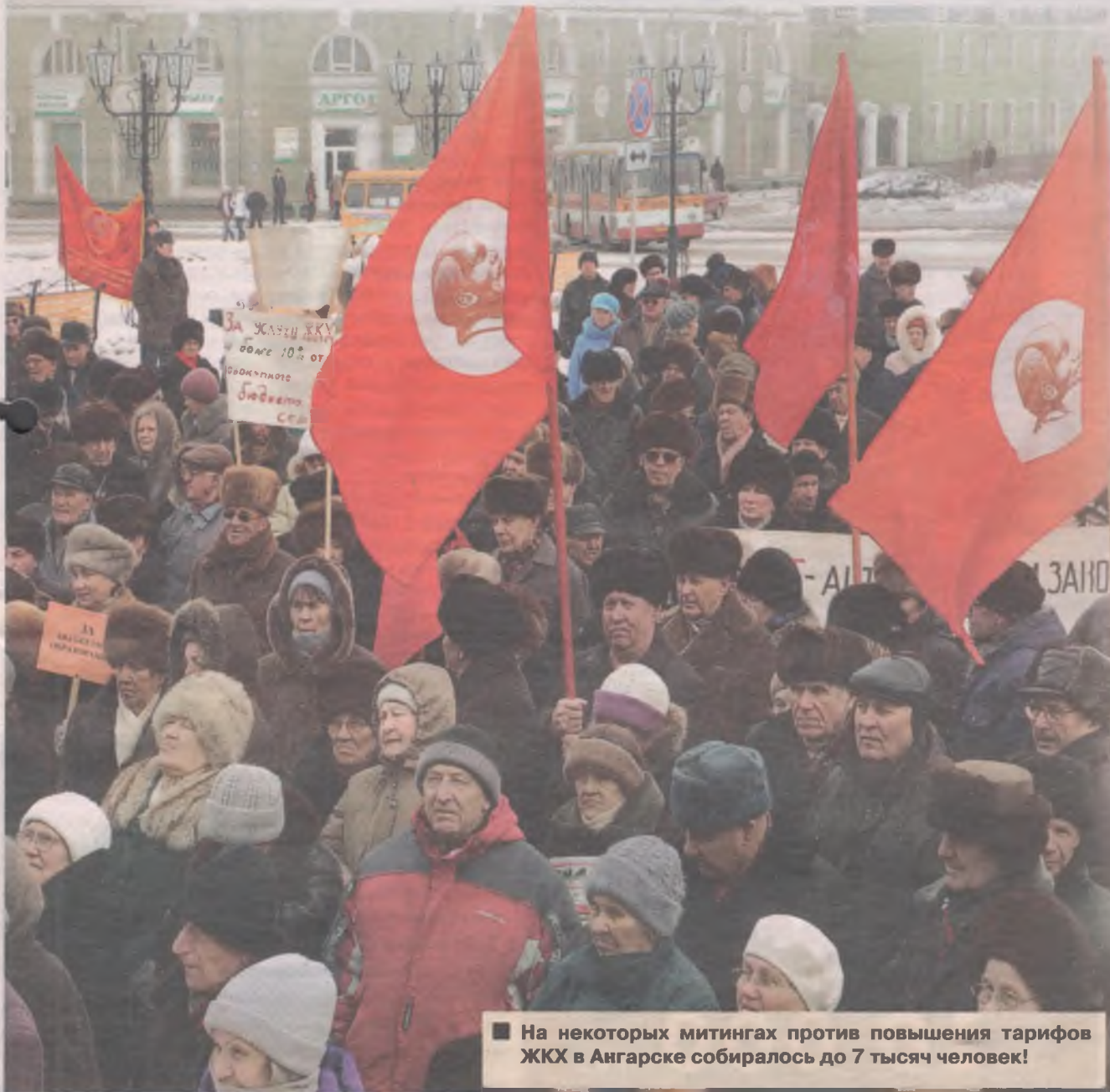
■ На некоторых митингах против повышения тарифов ЖКХ в Ангарске собиралось до 7 тысяч человек!

Число мест, где ангарчане могут выразить свое мнение или митинговать, в нашем городе сократилось с семи до трех. Нам ещё повезло. В областном центре митинговать теперь можно только в одном месте – на площади Труда, перед зданием иркутского цирка.