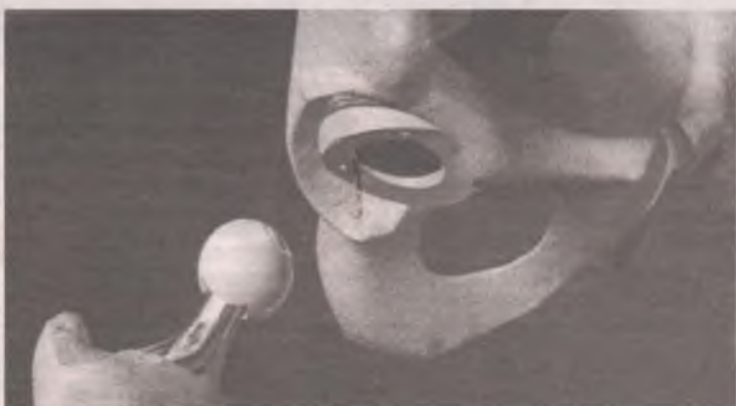
Мало записаться на приём к врачу – надо до него ещё дожить.

Ольга КРАСНОВА