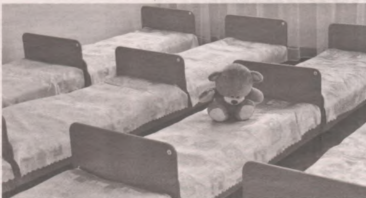
Никто из детей не госпитализирован, все лечатся дома.

Она пояснила нашей газете: - На сегодня (четверг, 5 марта) восемь детей из старшей группы имеют схожие симптомы заболевания: боль в животе, рвота. Температуры нет. Но никто из них не госпитализирован, все лечатся дома. Состояние нормальное. Первый ребенок в этой группе пожаловался на плохое самочувствие в понедельник. Его забрали родители. Во вторник в группе присутствовали 22 ребёнка из 25. Двое отсутствовали по семейным обстоятельствам. Со вторника на среду ночью началась рвота у пятерых детей. «Скорою» вызывали одному ребёнку. В среду в группу не вышло шестеро. Ещё двоих отстранили в течение дня. Итого восемь детей, и все из одной группы. Группа на сегодня работает. Представители здравоохранения взяли анализы у всех детей. Роспотребнадзор взял все необходимые пробы. Говорить о диагнозах ещё рано, но предварительно по симптоматике специалисты сказали, что это похоже на ротавирус. У первого заболевшего ребёнка такие же симптомы