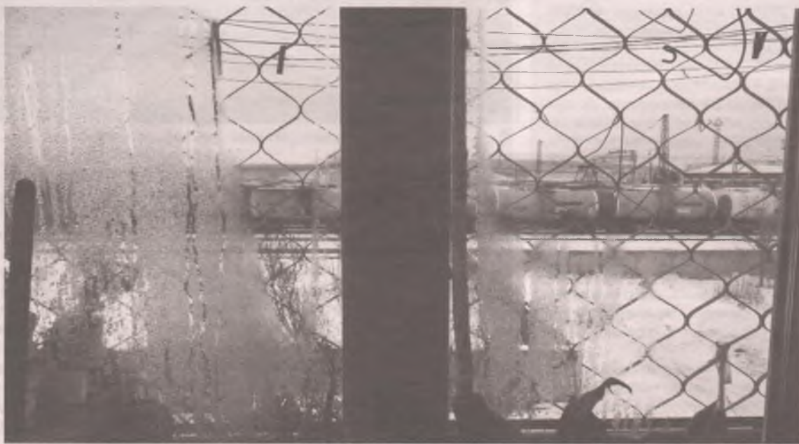
Расстояние от дома до железной дороги – 45 метров.

Вопрос, кто же все-таки поставит тепло жителям промышленного массива и кто должен нести за это ответственность, приобретает просто детективный характер. Разрешить эту проблему могут только местные власти, обязав теплоснабжающую организацию заключить договоры с собственником. В ответе на запрос нашей газеты сказано: в настоящее время администрация округа «продолжает работу по достижению договоренностей с ОАО «РЖД». Пока, судя по всему, безуспешно.