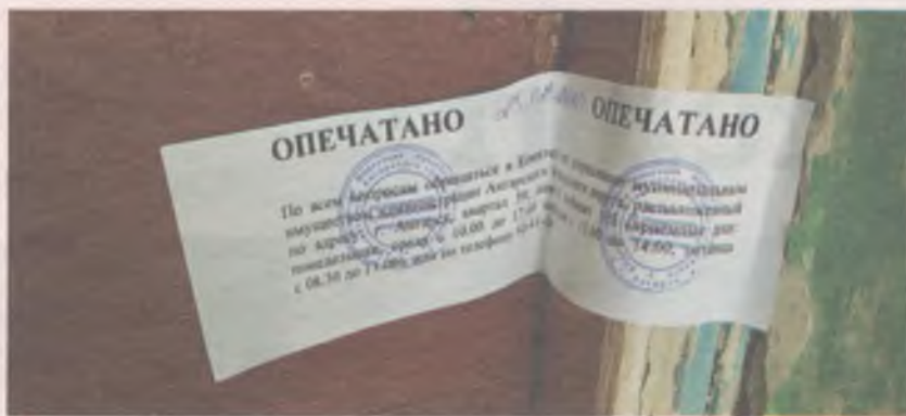
■ Дверь той самой квартиры. Ещё одно освободившееся муниципальное жильё.

Люди, знающие умершую с детства, рассказали нашей газете, как