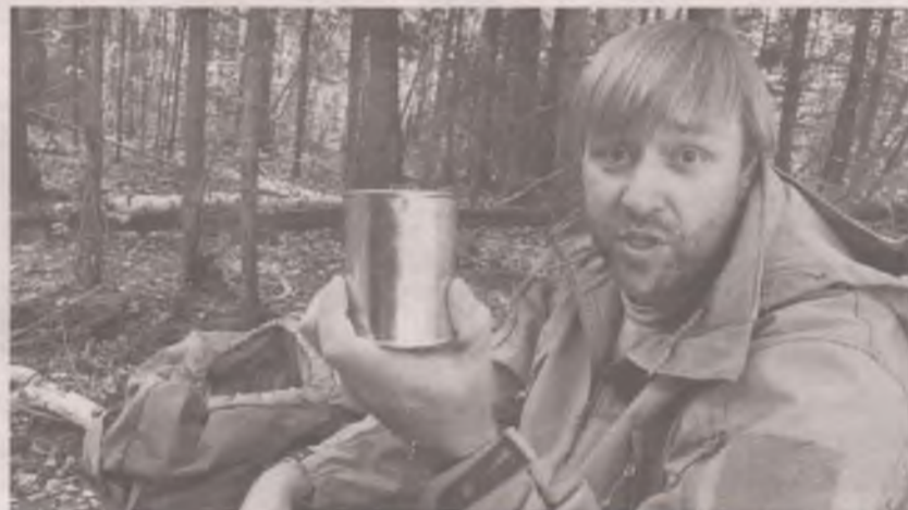
■ Наши люди знают, что тушёную говядину можно есть просто так. Тоже вкусно.

«Сколько в банке мяса, а сколько бульона? Это соотношение регламентирует показатель массовой доли мяса и жира. Согласно ГОСТу, она должна быть не менее 58%. Стандарт Роскачества ужесточил требования: мяса и жира должно быть не менее 60%. Но что если производитель положит в банку один жир? О каком тушеном мясе тогда может идти речь? Для этого введен показатель, регламентирующий количество жира в продукте, его должно быть не более 17% по ГОСТу и не более 12% согласно стандарту Роскачества. Количество белка тоже регламентировано – не менее 15%».