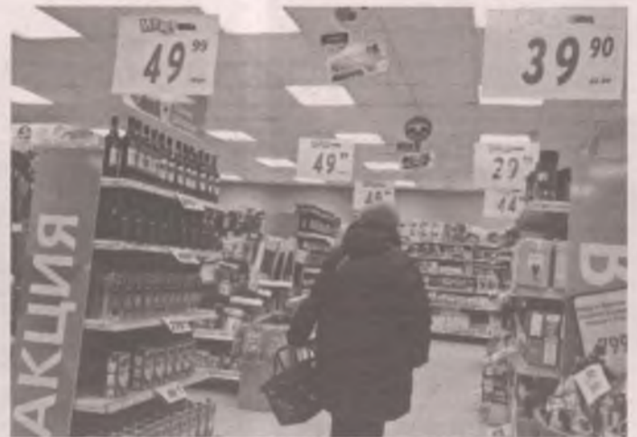
■ Если на ценнике стоит одна цифра, а в чеке другая – требуйте перерасчёта.