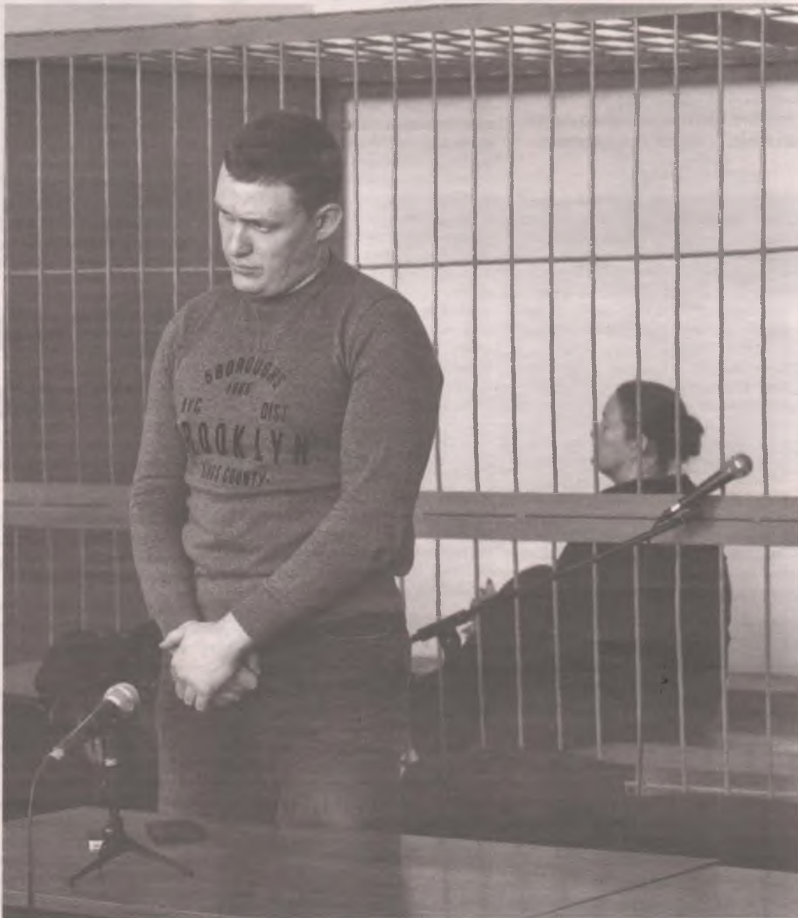
■ За три года красивой жизни платить придется шестью годами на зоне.