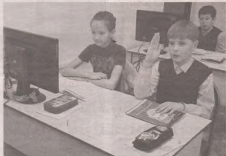
■ Компьютерная грамотность – важное направление в учёбе.

Гимназия вошла в рейтинг «Лучшие 500 школ России», стала лауреатом-победителем открытого публичного всероссийского смотра-конкурса образовательных организаций.