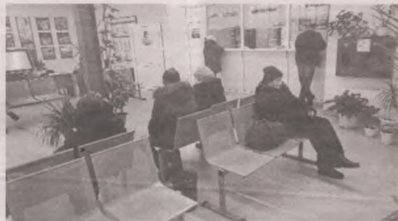
Ждать автобус с комфортом ангарчане мечтали десятилетия. Теперь десятилетие будем мечтать об асфальтировании посадочных площадок.

При этом администрация заверяет: «Учитывая высокую значимость данного объекта для города, муниципалитет заинтересован в сохранении функционала здания и в случае смены собственника приложит все усилия для этого. В данном случае продажа имущества будет осуществляться с обременением права собственности правами арендатора. Согласно ст. 617 Гражданского кодекса РФ переход