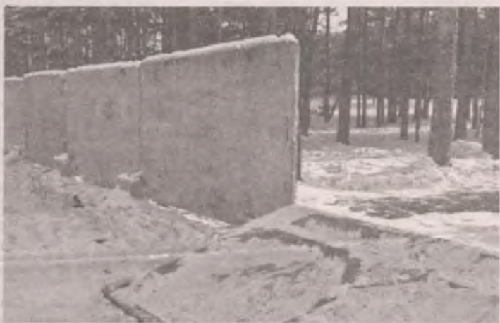
■ Люди хотят любоваться соснами, а не бетоном.