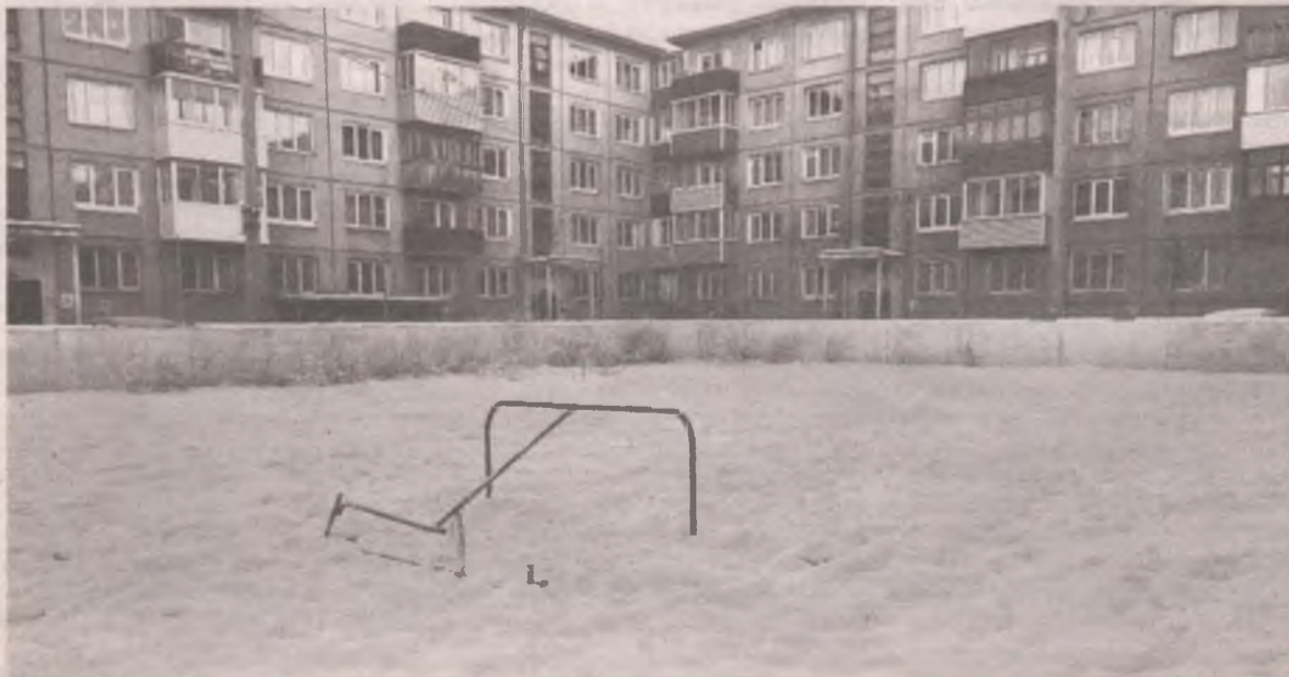
На корте в ба микрорайоне нет детей, потому что взрослые не могут договориться.

Беседовала Мария СУХАНОВА