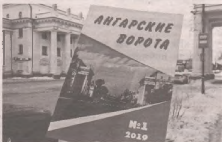
■ Издатели нового альманаха надеются сделать его одним из брендов нашего города.