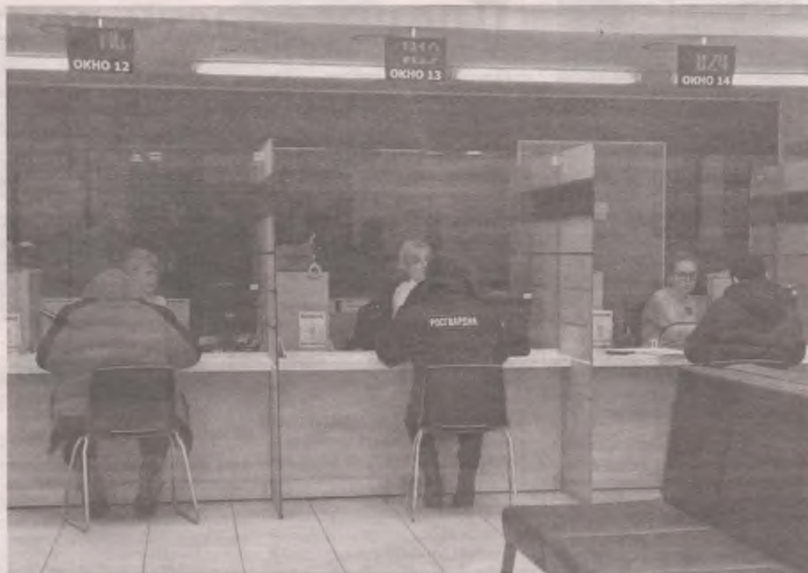
■ В этом мире неизбежны только смерть и налоги (Б. ФРАНКЛИН).

Неизвестный блогер, пользуясь изменениями, которые были внесены в ст. 45.1 НК РФ федеральным законом от 29.09.2019 № 325-ФЗ, ввел в заблуждение определенную часть населения страны. На самом деле статья 45.1 была введена в Налоговый кодекс федеральным законом от 29.07.2018 № 232-ФЗ, а в 2019 году была дополнена федеральным законом от 29.09.2019 № 325-ФЗ. Смысл ее в том, что, начиная с 1 января 2019 года, упрощался порядок уплаты только физическими лицами имуществен-