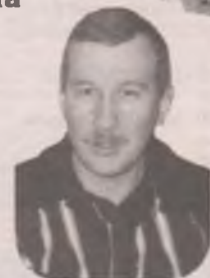
От всех родных

С двумя пятерками тебя, Пускай поет твоя душа, И пусть сбываются мечты, Здоровье только береги!