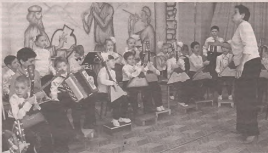
■ В гимназии научат всему, даже игре на балалайке.

Многих сейчас волнует вопрос: насколько конкурентоспособен одиннадцатиклассник, на какую форму обучения он может претендовать – коммерческую или бюджетную? Ответим: за последние три года 98% выпускников гимназии № 8 поступают в вузы, причем 70% из них на бюджетной основе. Гимназия № 8 славится тем, что полученные здесь знания и отметки выдерживают различные экзаменационные проверки. Если это четверка – то настоящая, если золото – то самой высокой пробы. Может быть, на фоне некоторых школ города количество медалистов и не очень велико – зато какие это дети! Ученики гимназии ежегодно являются победителями и призерами олимпиад, конкурсов, выставок различного уровня.