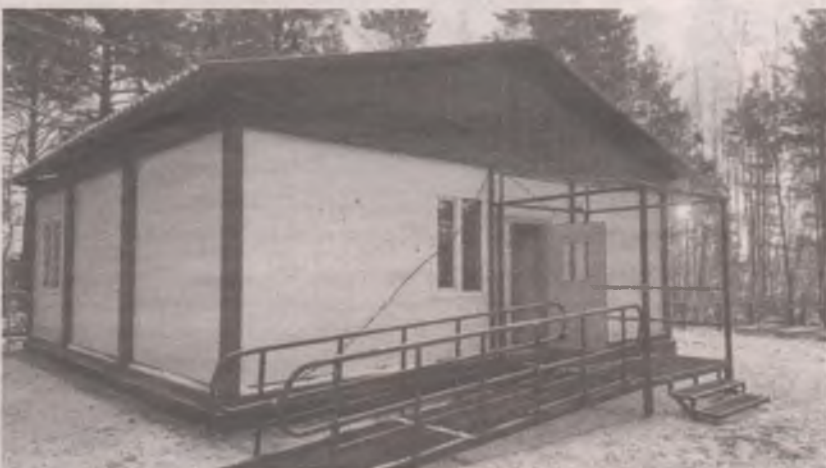
■ Почему долгожданные ФАПы в некоторых посёлках области до сих пор не работают, разбирались депутаты ЗС.

Обозначенные проблемы и вопросы совершенствования системы здравоохранения Иркутской области и ее первичного звена остаются на совместном контроле депутатов и регионального правительства. Они настроены вместе отработать их решение.