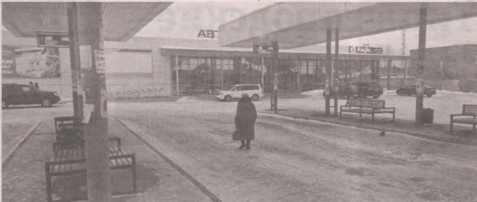
У нынешнего собственника нет возможности благоустроить территорию новой автостанции. Администрации АГО эта «гигантская» работа тоже оказалась не по карману.

Инвестор и городская администрация минувшим летом за это здание судились. На сайте Арбитражного суда Иркутской области есть решение о признании права собственности на здание, в котором работает автостанция