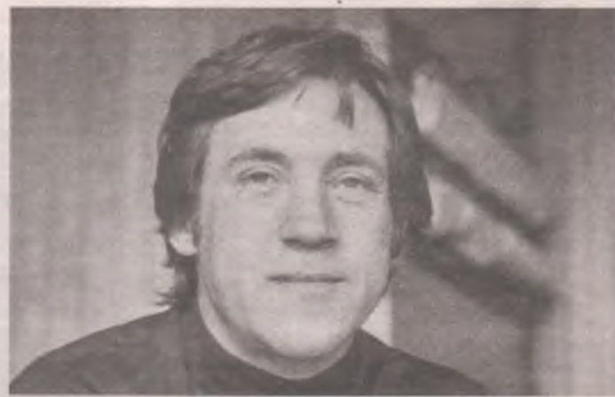
■ 25 января – день рождения Владимира ВЫСОЦКОГО.