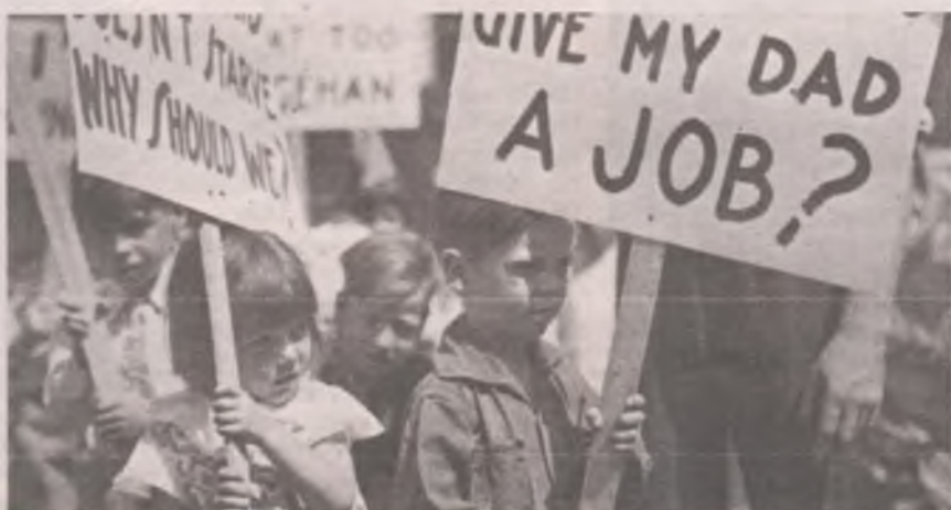
■ Во время Великой депрессии люди в США оказались не только без работы, но и без жилья, поскольку многие жили в арендованном или взятом в кредит. На плакате на снимке написано: «Кто даст моему папе работу?».

Как в этой сложнейшей обстановке правительству выкрутить и президенту остаться на своём посту? Учёные и политики говорят, что страна находится перед новым этапом развития. Будем надеяться, что этот новый этап, новая экономическая реальность благоприятно отразится в первую очередь на благосостоянии населения, иначе страну ждет массовое недовольство граждан, как это происходит в странах со слабой экономикой или там, где существуют так называемые пятые колонны. У нас есть и первое, и второе. Бюджет страны активно тратится пока лишь на текущие нужды. А надо вкладываться в организацию новых рабочих мест, поддержку неработоспособного населения, развитие малого и среднего бизнеса во всех регионах страны.