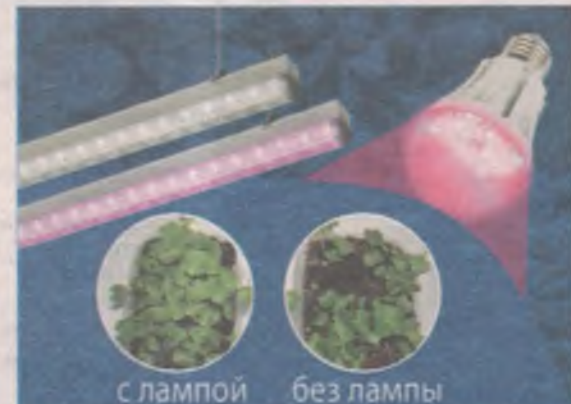
с лампой без лампы