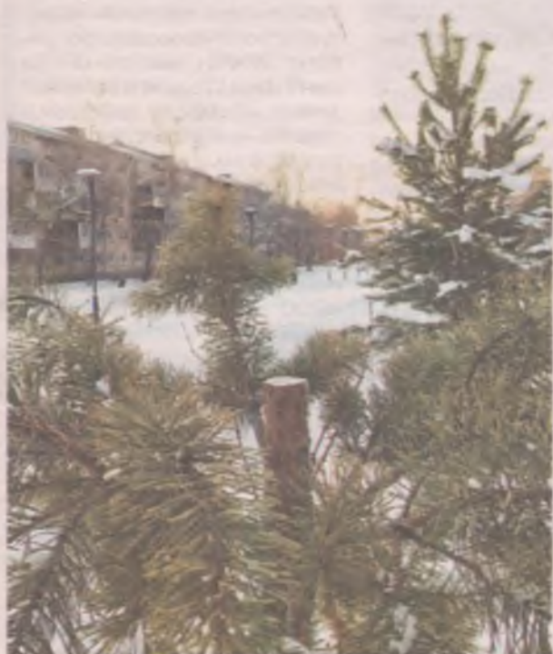
■ Сосны на Сталинградской аллее...