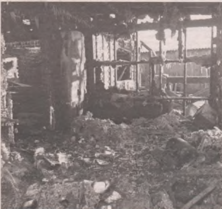
■ Люди выскочили из горящего дома, захватив только детей. Даже паспорта сгорели.

Мария СУХАНОВА