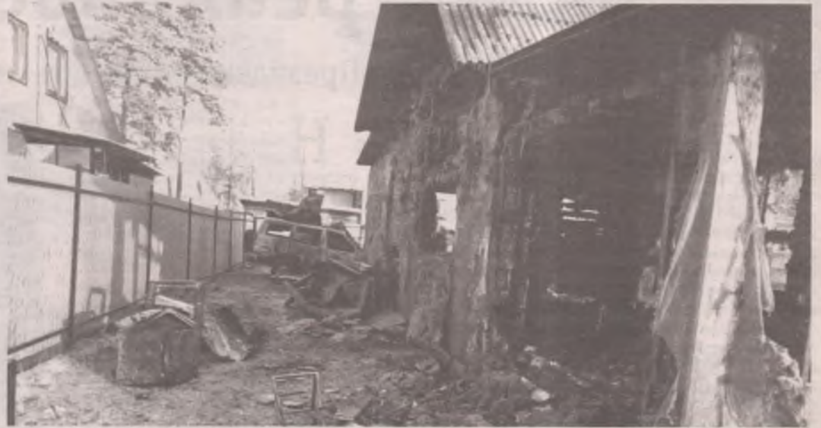
■ За три часа молодая семья лишилась всего, что у неё было. Причины пожара ещё не установлены.

- Первой к месту пожара прибыла в 5.52 машина пожарной