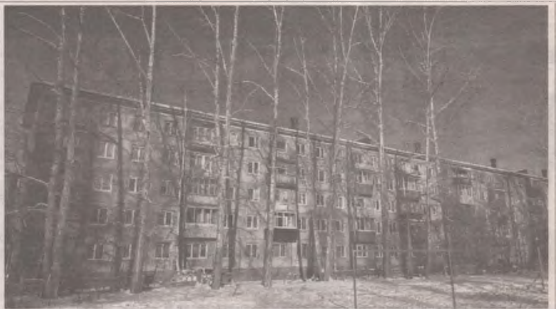
■ Такое дерево если упадет, шуму будет много.