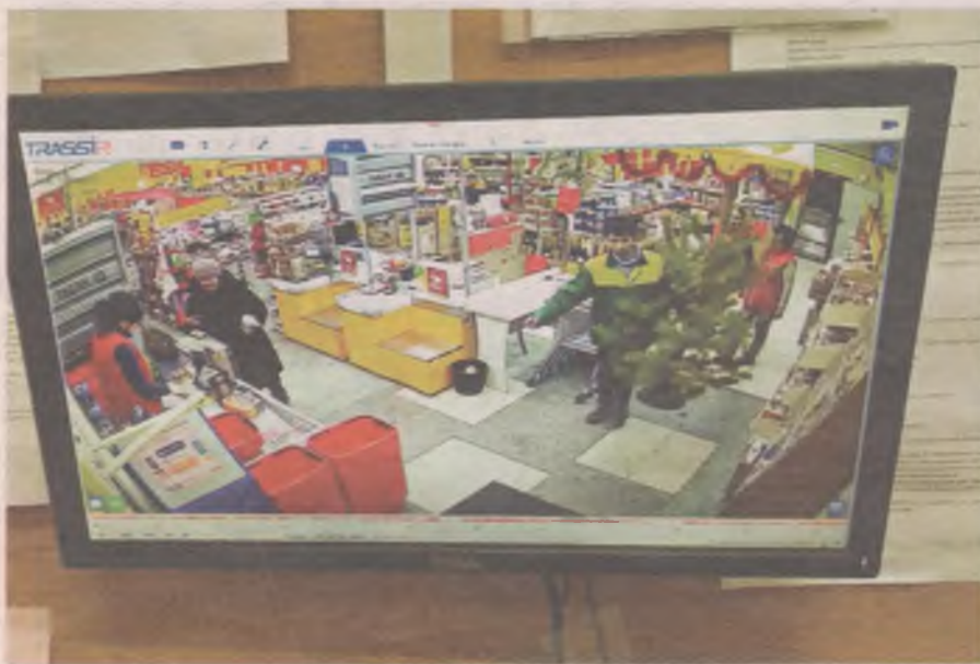
■ Директор магазина показала кадр видео, на котором они ставят ёлку 15 декабря.