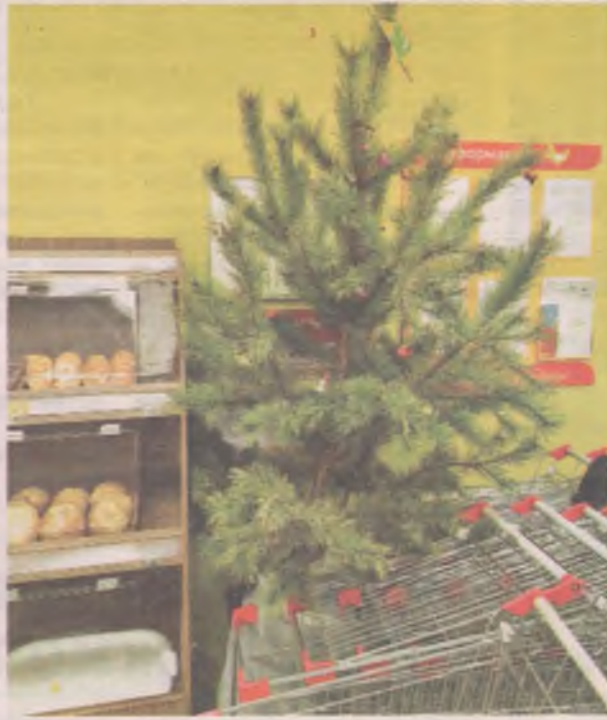
■ ...и в магазине.