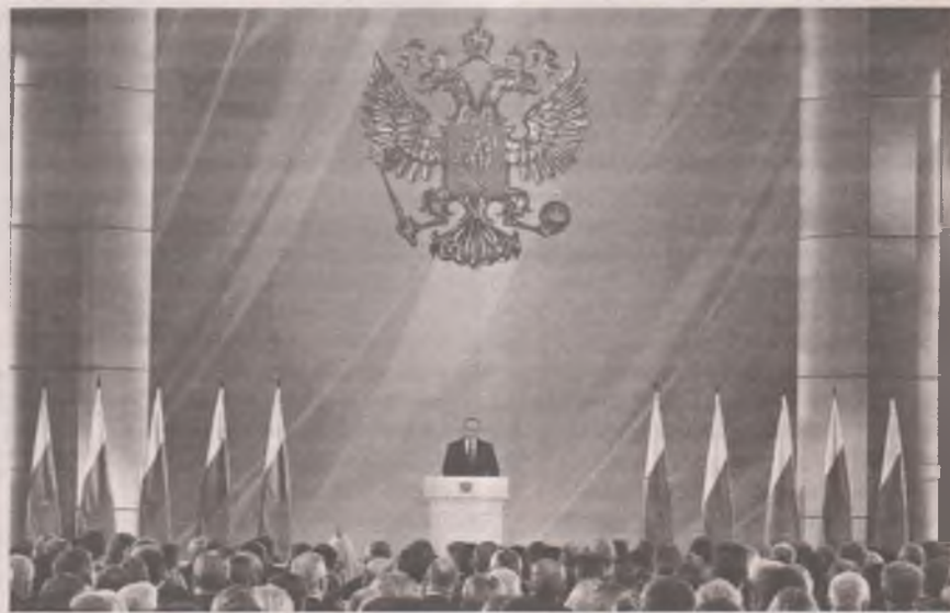
■ Цитата: Владимир ПУТИН Федеральному собранию: «Сегодня в нашем обществе чётко обозначился запрос на перемены».

Интересно, что по количеству бедных граждан Россия находится вовсе не впереди планеты всей. Например, если в США бедных насчитывается 23 процента, а в Англии - 8 процентов, то в России, согласно официальной статистике, всего 13 процентов таких граждан от работоспособного населения. Кстати, в 2000