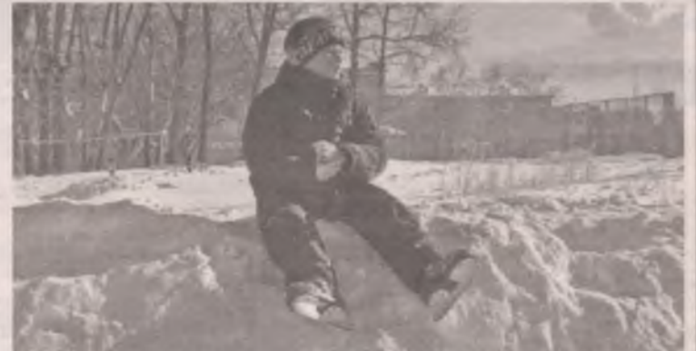
■ Попасть на каток в «Ермаке» или «Ангаре» можно только в специально отведенное для массовых катаний время.

В нашем городе два уличных катка для массовых катаний: на стадионах «Ермак» и «Ангара». Оба в первую очередь предназначены для тренировок спортсменов.