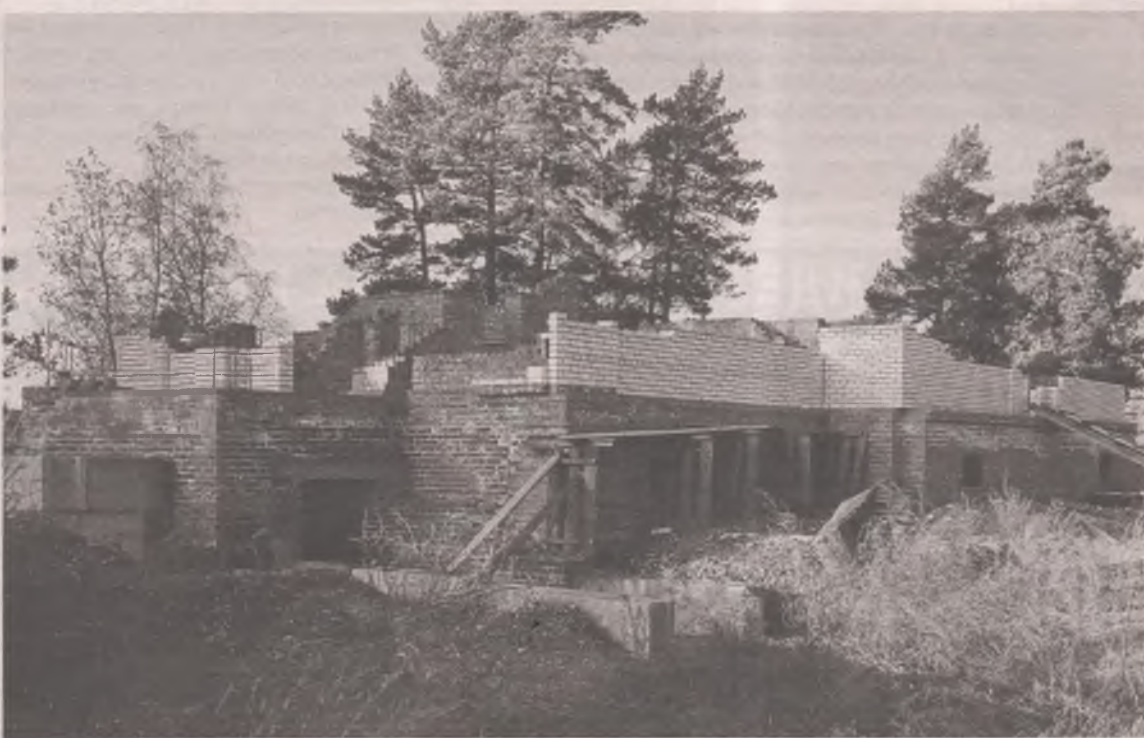
■ Работы по строительству храма идут своим чередом.

БИК 042520607 ИНН 7707083893 КПП 380101001