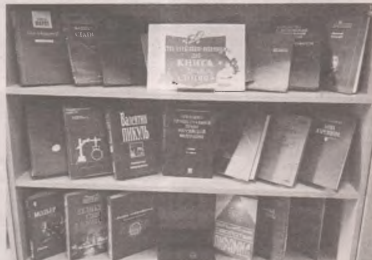
■ «Уголовно-процессуальное право РФ» рядом с книгой «Волшебные свойства пирамид»? Да, в этом что-то есть.