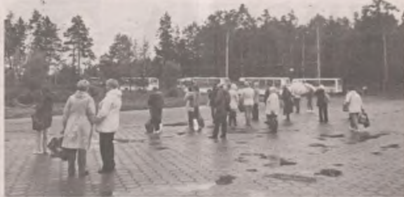
Железнодорожный вокзал. Дождь. Спрятаться негде.