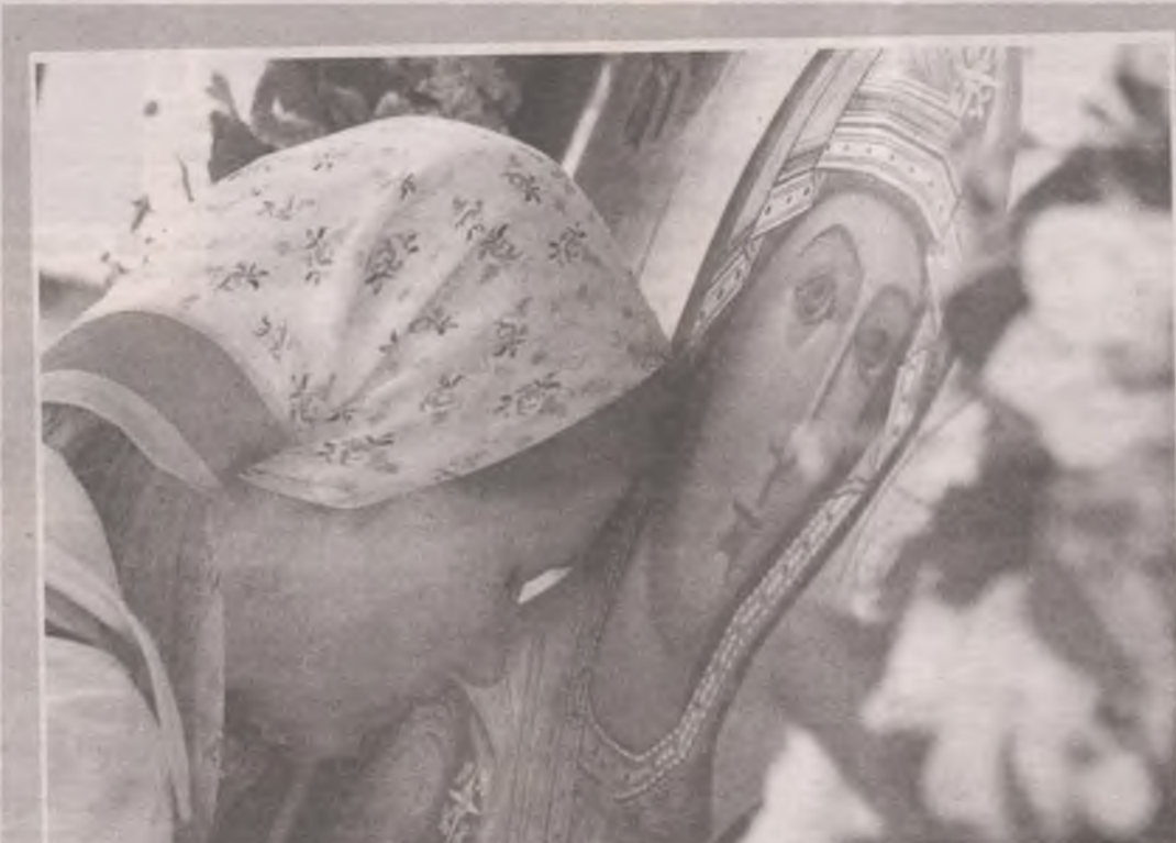
■ Искренняя молитва делает чудеса.

Он послушно отстал. В следующие несколько дней женщина побаивалась заходить в собственный двор, предварительно оглядывая дорожки. Незнакомец не появлялся. Но через месяц вдруг возник снова! И ходил с завидным упорством, повторяя одно и то же: ему стыдно, что про него поду-