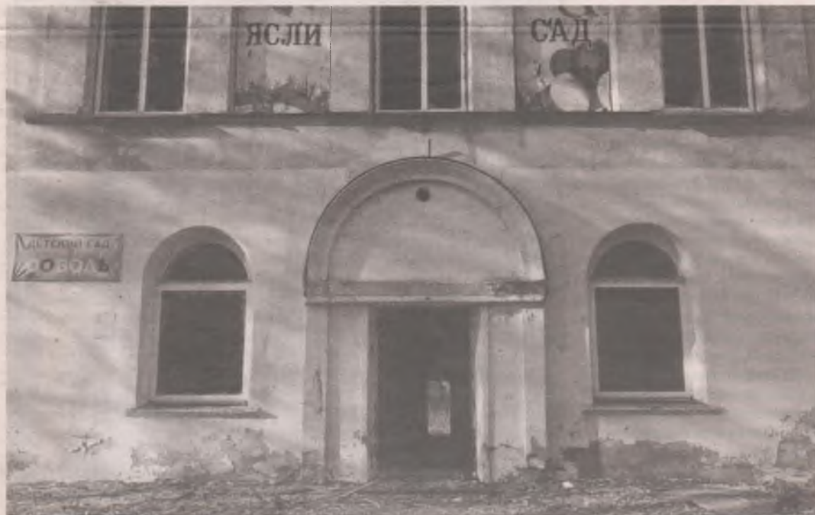
Трудно поверить, но у этого разрушенного двухэтажного здания есть хозяин.