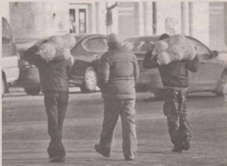
■ Рецептами приготовления капусты на зиму мы поделимся немного позже.

В капусте достаточно много йода, что делает ее незаменимой в питании больных щитовидной железой. А вот азотистых соединений в ней мало, поэтому она