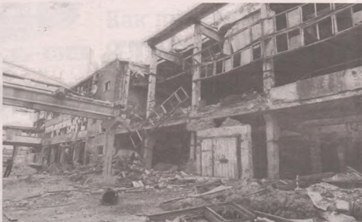
■ Если не провести рекультивацию «Усольехимпрома», регион ждёт глобальная экологическая катастрофа.

- На этом совещании были представители различных институтов, которых руководитель