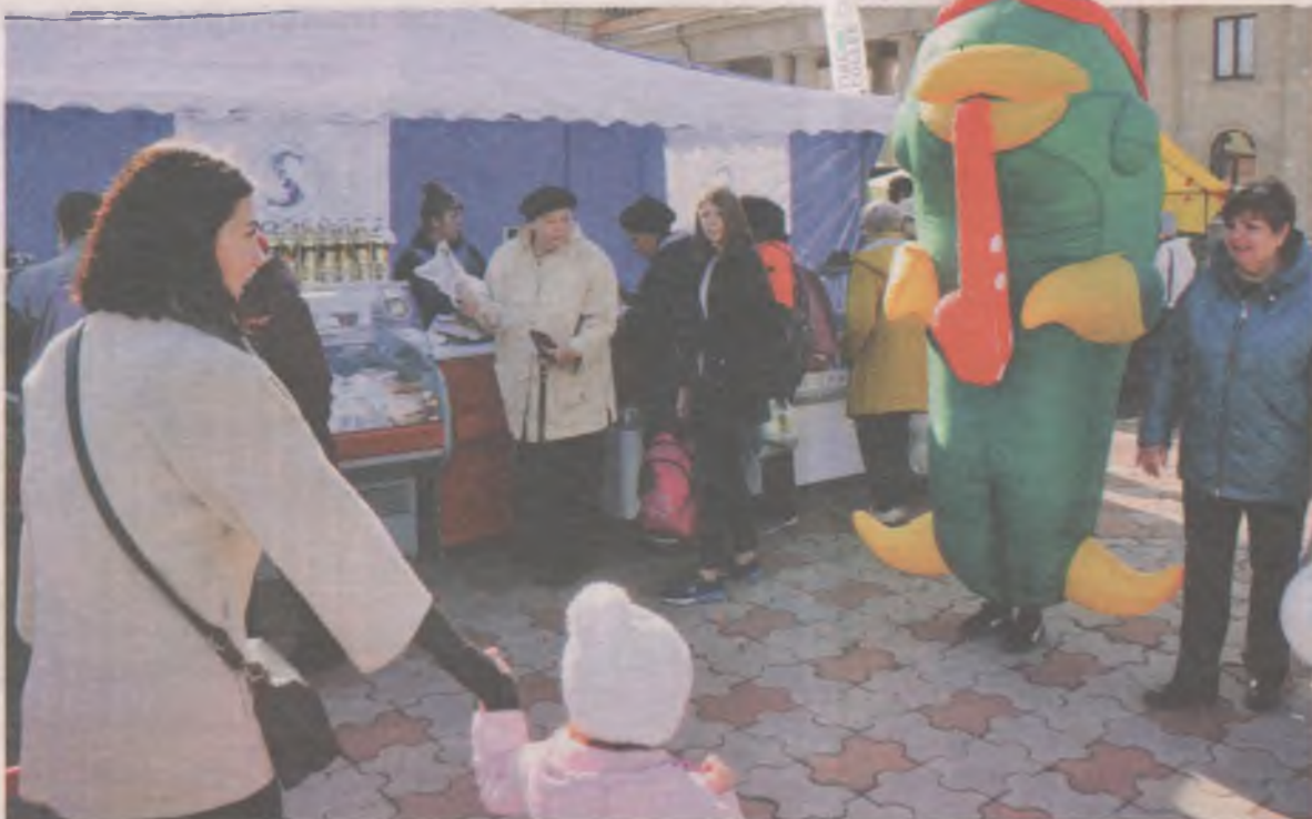
Очередь возле торговой точки компании «Сарсенбаев» не прекращалась всю ярмарку: желающих приобрести рыбу и мясо по низким ценам было хоть отбавляй. Компания ежегодно принимает участие в ярмарке и специально ради такого события снизила цены на продукцию. Горбуша стоила 125 рублей за килограмм вместо 169 рублей. Как же не взять?

Людей привлекали на ярмарку низкими ценами и местным качественным продуктом. Картофель продавали в больших сетках по 17-18 рублей за килограмм. Не сказать, что это самая низкая цена. В магазинах можно найти картошку и по 14 рублей за килограмм – мелкую, нефасованную, но тем не менее. Садоводы продавали картошку в ведрах – по 120-130 рублей. Яблоки на ярмарке стоили по 80-90 рублей, хотя в магазинах