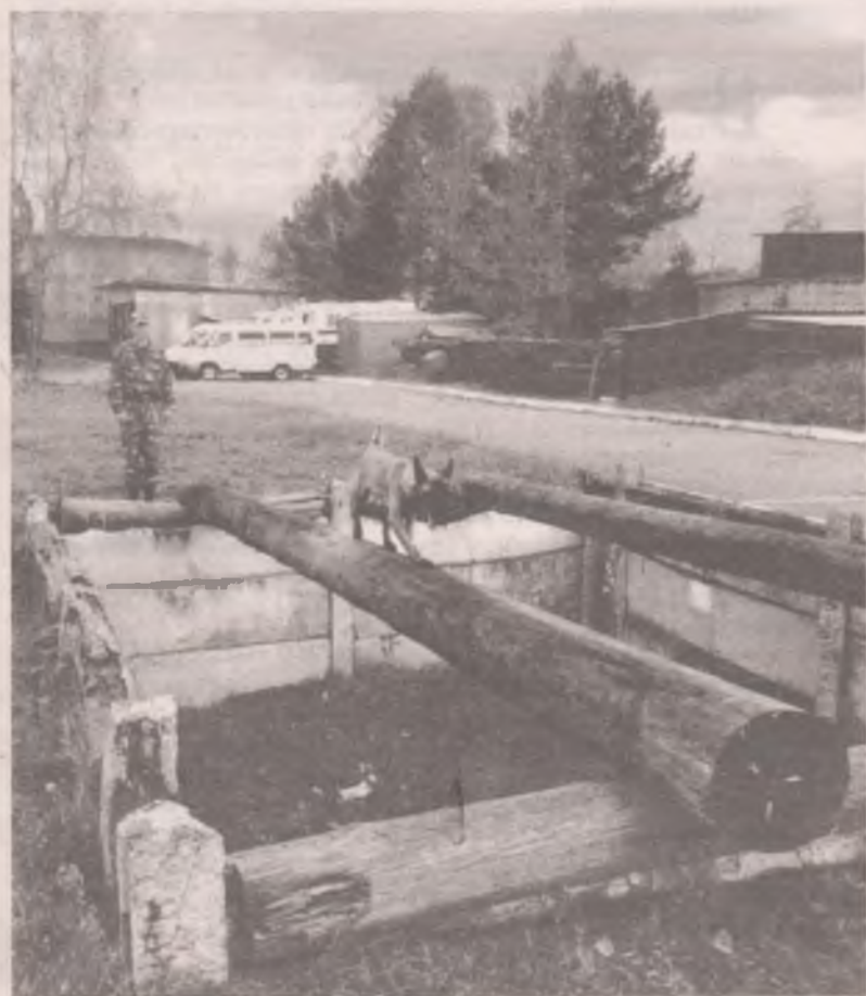
■ Андрей и Зая ни одного дня не мыслят без тренировки. Век служебной собаки короток, и надо успеть освоить все навыки ремесла.

Игорь КАРИН, фото предоставлено ангарским ОМОНОм