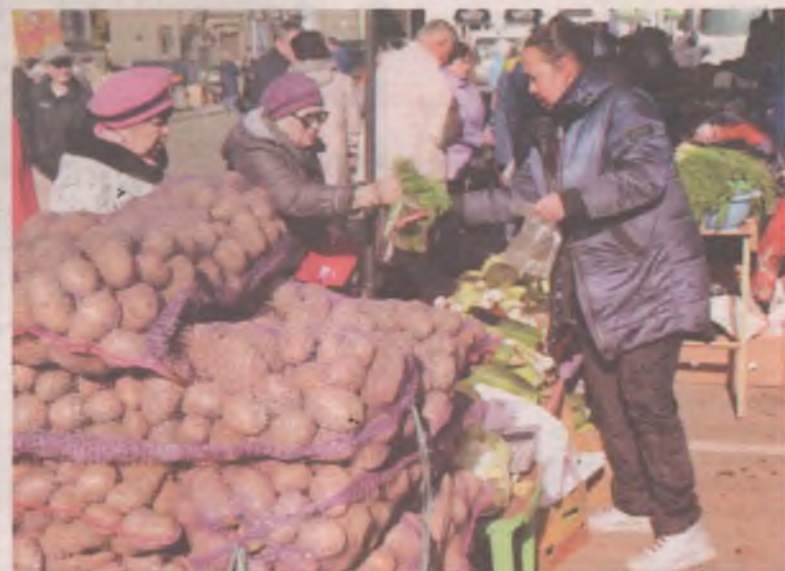
Из-за дождей урожай картофеля, как говорят садоводы, в этом году гораздо меньше. Так что на зиму картошкой лучше запастись уже сейчас, пока не подорожала.

уже и сейчас их можно найти по 50-60 рублей за килограмм.