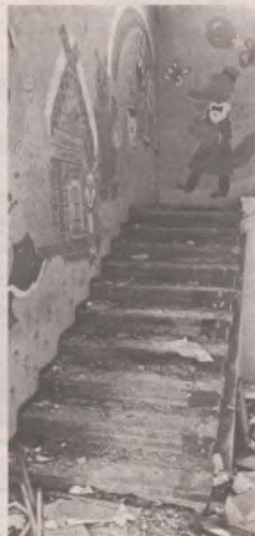
Дети бегают по лестницам без перил. Нужно ли говорить, к чему это может привести?