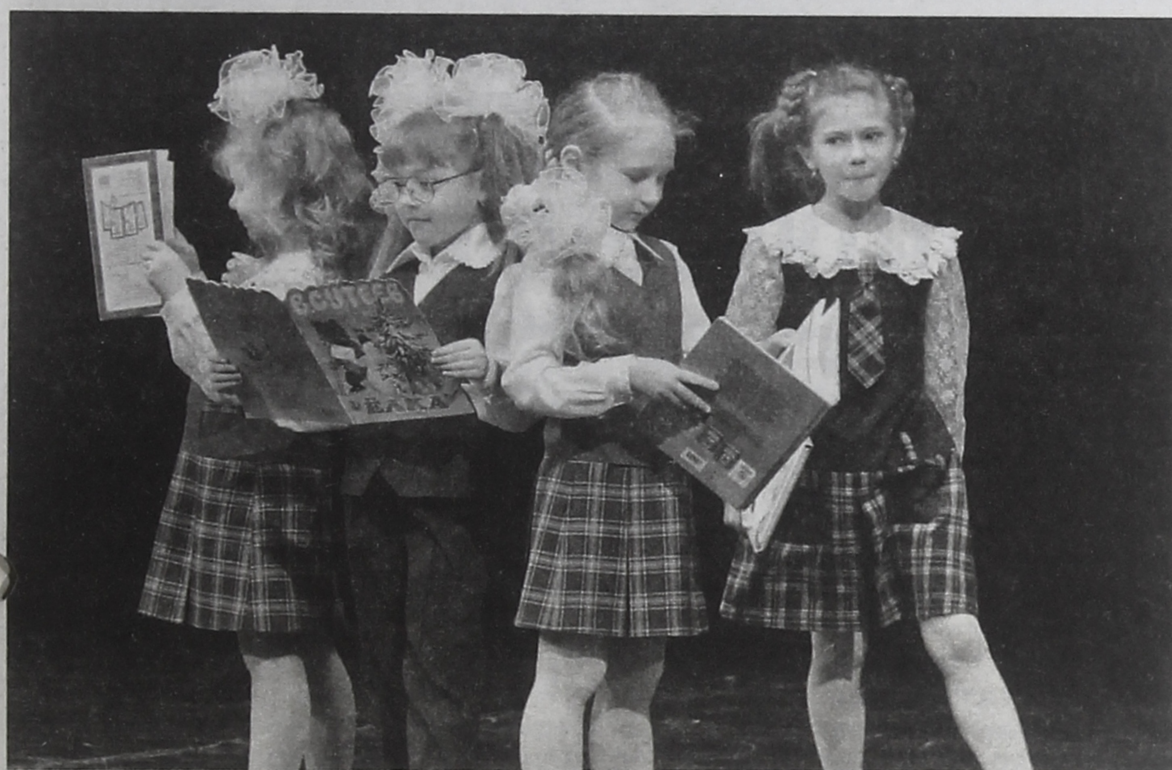
■ В моде – клетка. Школьная форма от ателье «Классика» открывала фестиваль.