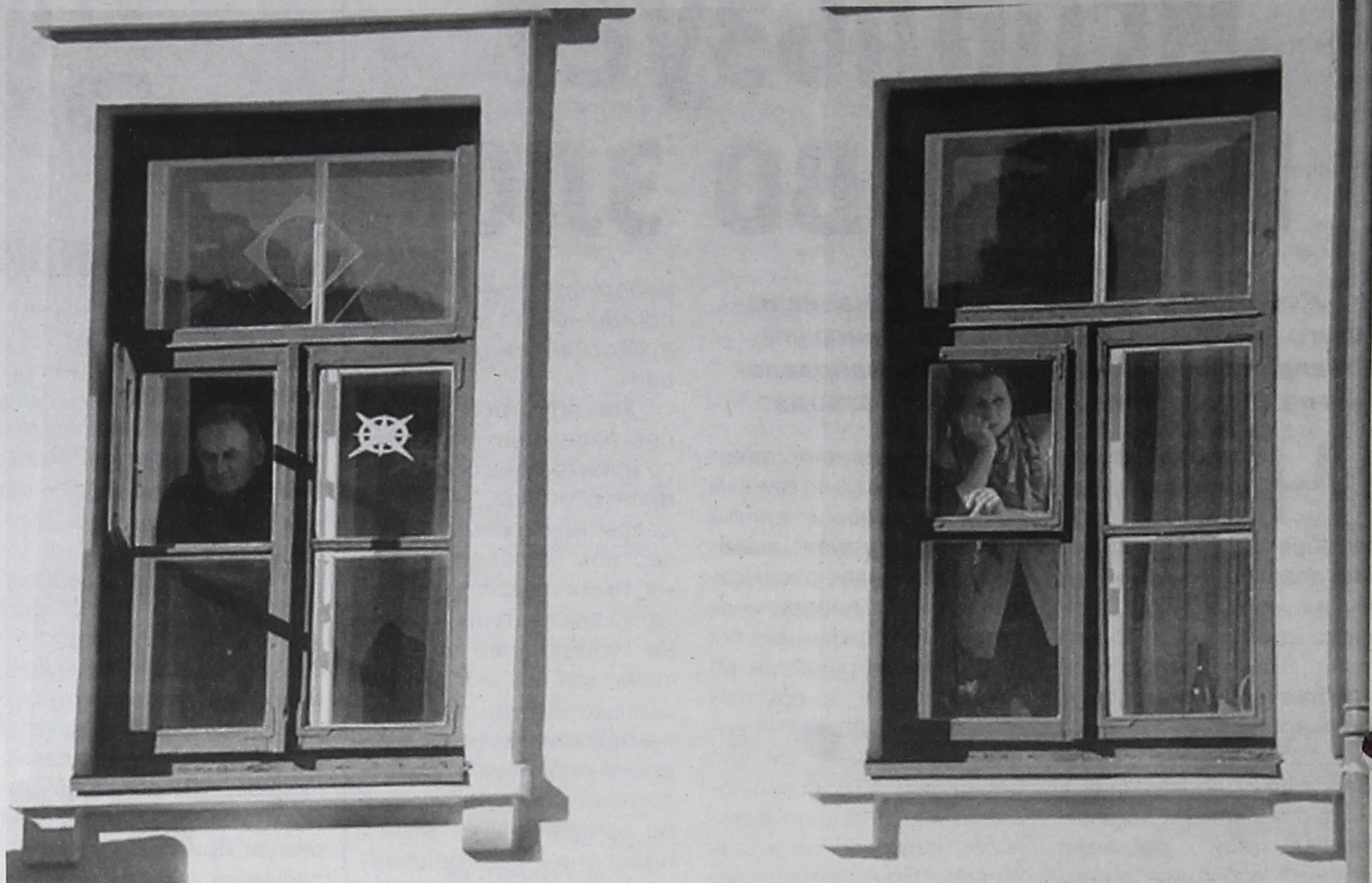
■ Главная причина всех неурядиц дома Б квартала 95 - отсутствие согласия между соседями.

Если жилое помещение оформлено не в общую собственность между вами, супругом и детьми или не осуществлена государственная регистрация права собственности на жилое помещение, вам необходимо засвидетельствовать у любого нотариуса обязательство об оформлении жилого помещения в общую собственность между вами, супругом и детьми. Данное обязательство представляется с заявлением и всеми вышеперечисленными документами в Пенсионный фонд по месту жительства.