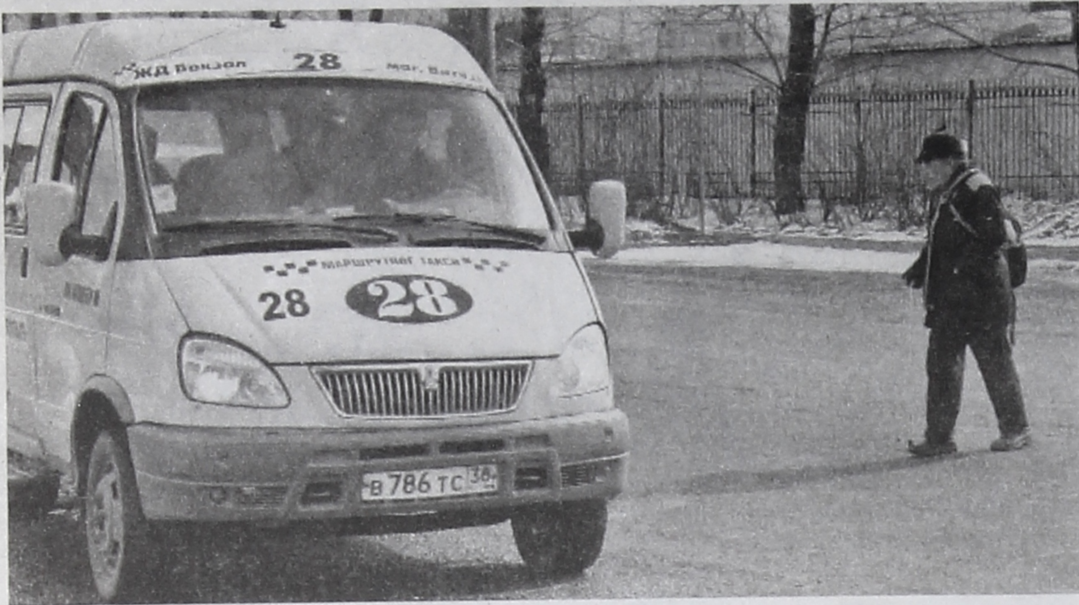
■ Льготники - самые активные пассажиры. Потому что ездят не за наличку, а по проездному. За это их водители и не жалуют.