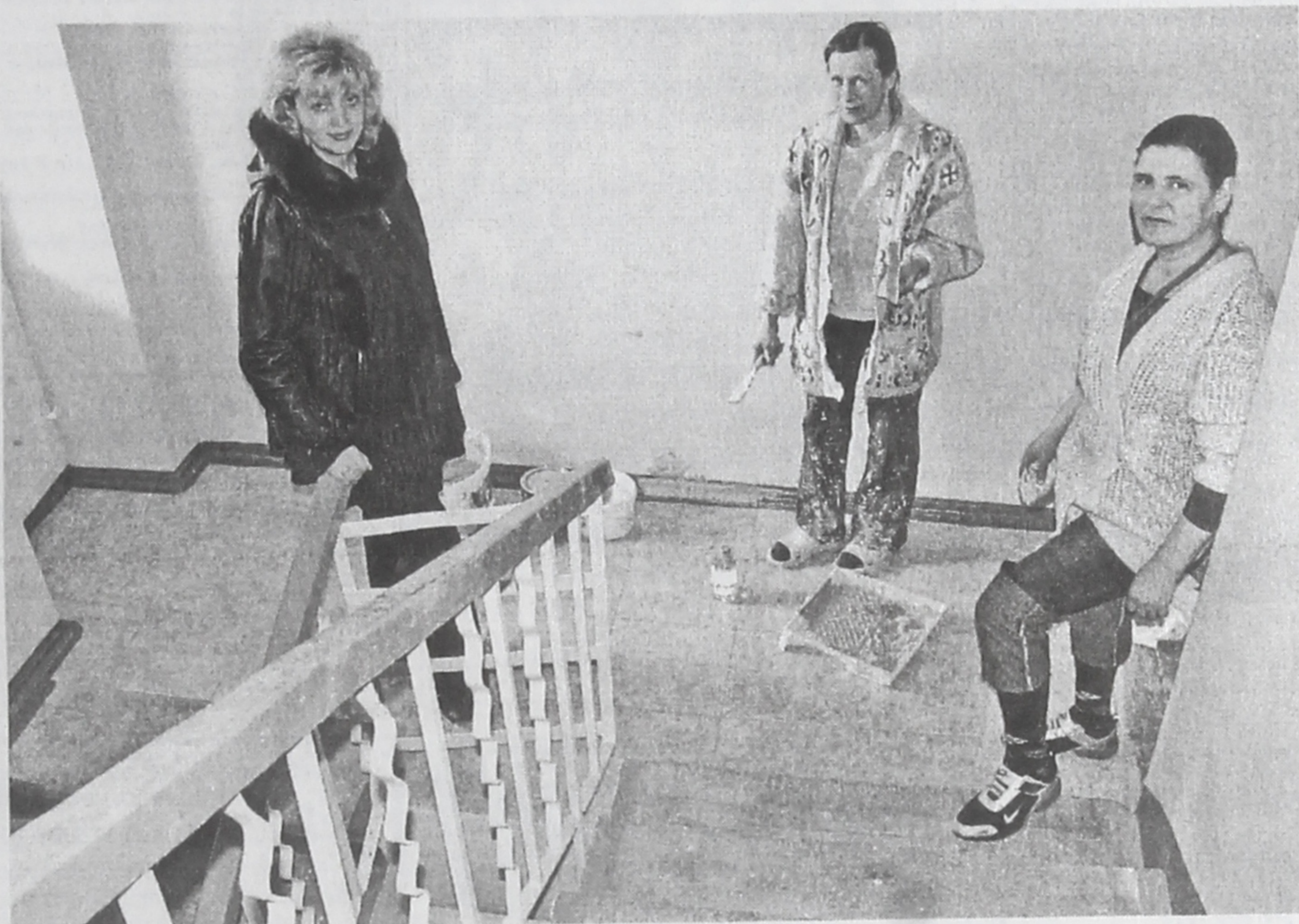
■ На ремонт подъезда - покраску, побелку и замену половой плитки - строительная фирма просила 39 тысяч рублей. Управляющая «Галактиона» (первая слева) смогла договориться за 30 тысяч.

Например, возьмем старый город. Капремонт внутренней сантехники (1688 метров) в четырехэтажном доме №1 квартала 47 (48 квартир) стоит 800 рублей за метр (включая стройматериалы и работу). Общая сумма - 1 млн. 350 тысяч 400 рублей. Из них жителям дома, если они организуют ТСЖ, придется заплатить 5% - 67 тысяч 520 рублей, каждой