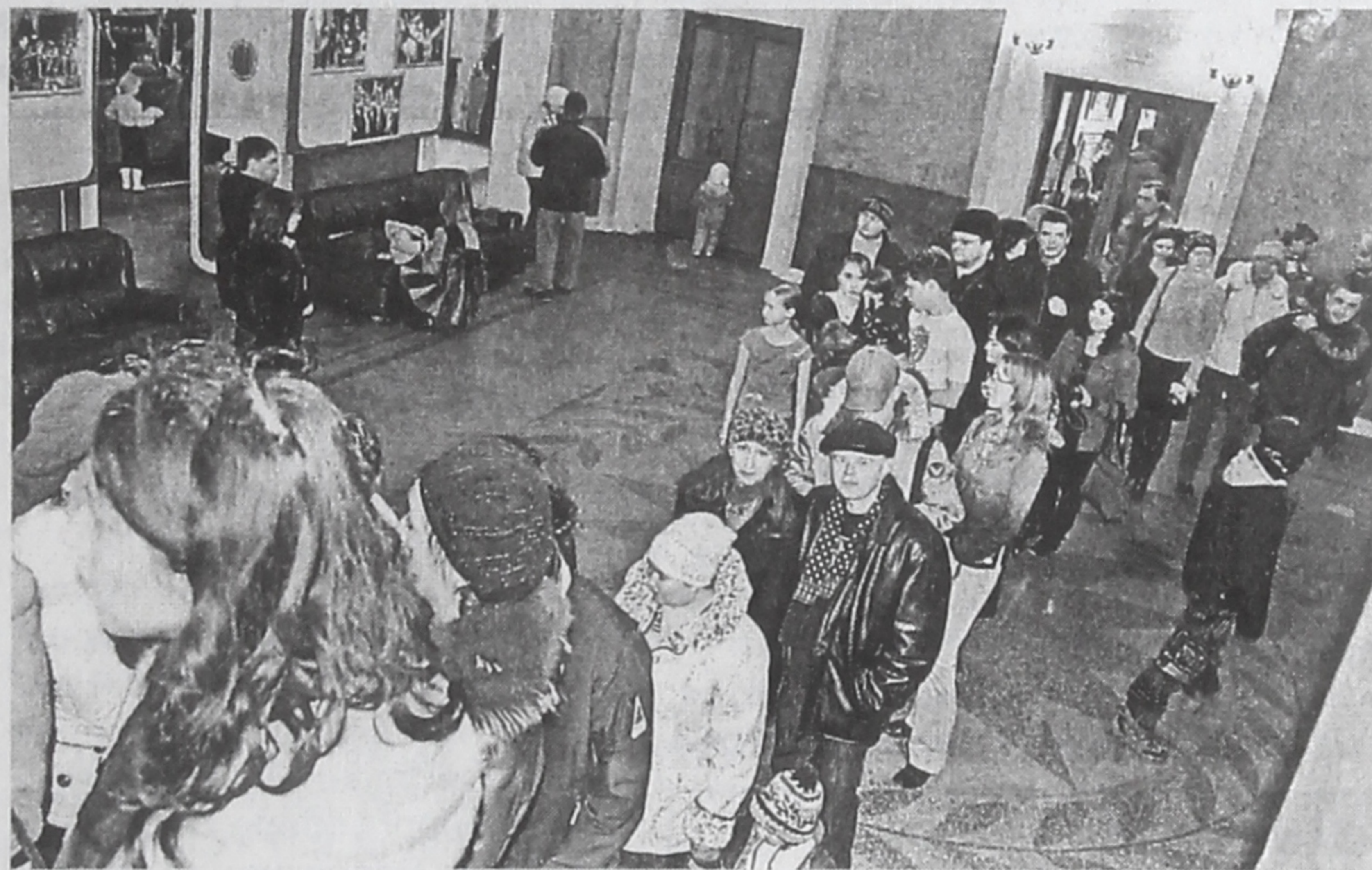
■ Посмотреть на кошек пришел весь город.

Люди шли (за деньги! 70 рублей с человека) посмотреть на животных,