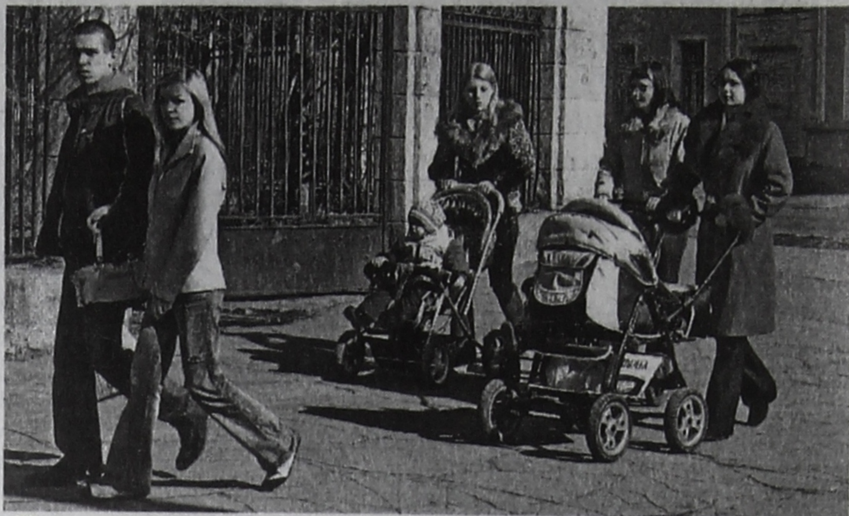
■ Молодежь чувствует себя в городе комфортно.

Профессионально и грамотно выстроенная система подготовки серьезно сокращает время на адаптацию в коллективе и в технологическом процессе. Будучи еще студентом вуза, потенциальный производитель по сути является членом трудового коллектива. Очевидно, что создавать особые программы для молодых специалистов нет ника-