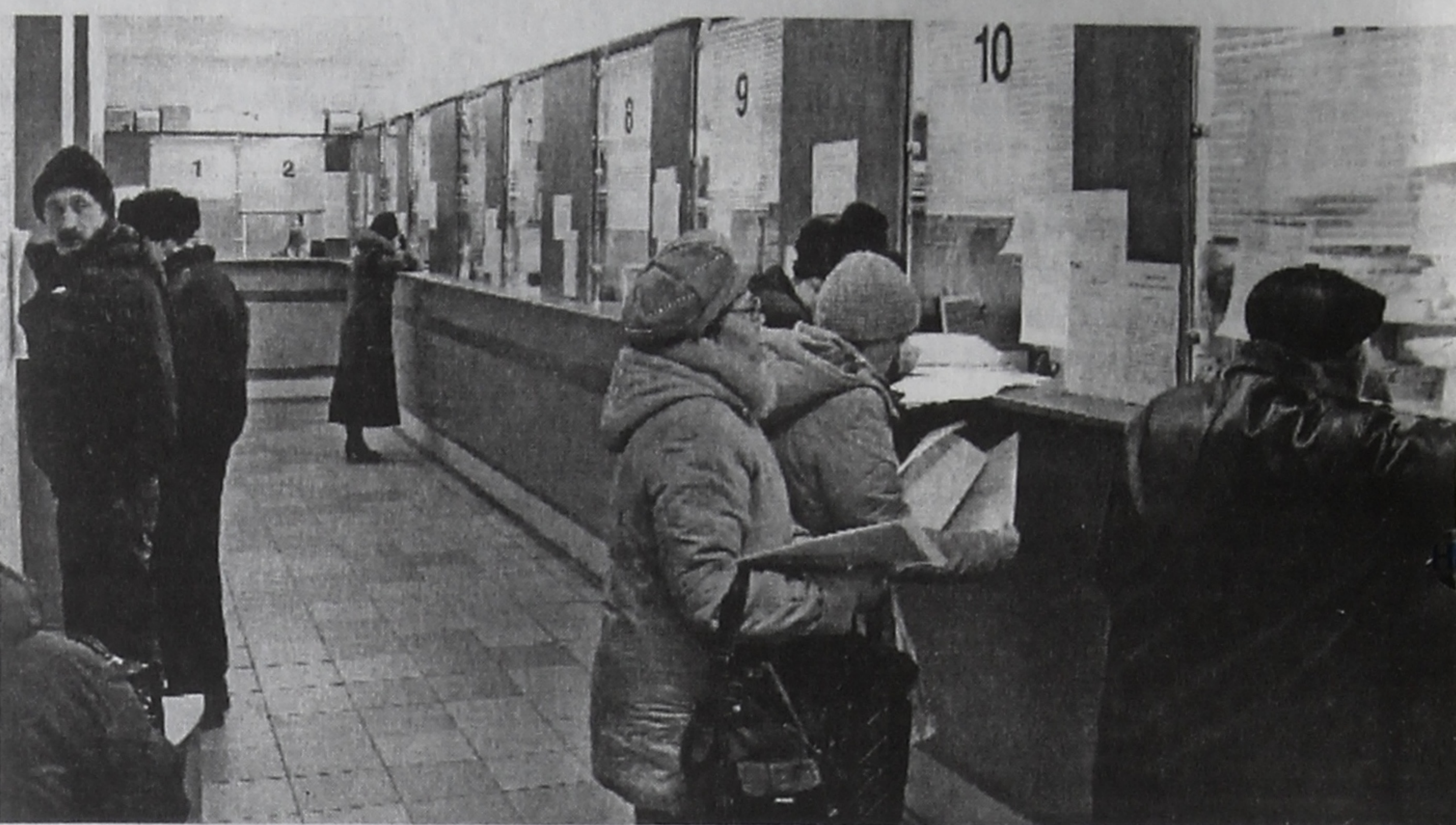
■ Операционный зал налоговой инспекции, где можно сдать декларацию. Работает 11 окон.

- Если даритель и одаряемый близкие родственники (дети, супруги, родители, бабушки и дедушки), то этот подарок налогом не облагается. Но при этом одаряемый должен доказать родство дарителя. А если они не являются близкими родственниками, то со стоимости подарка одаряемый подает декларацию и уплачивает 13-процентный