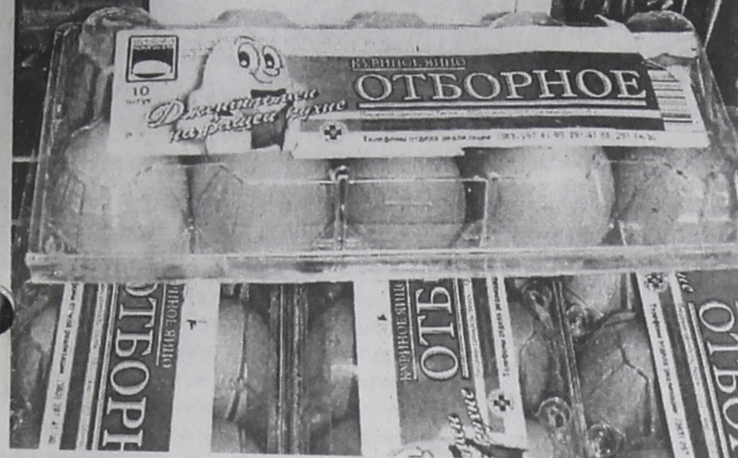
Яйцо – единственный продукт, цена на который за последние три месяца снизилась.

Россия, Новосибирская обл. Ед. изм. 1 дес. Цена: 40.00 руб.