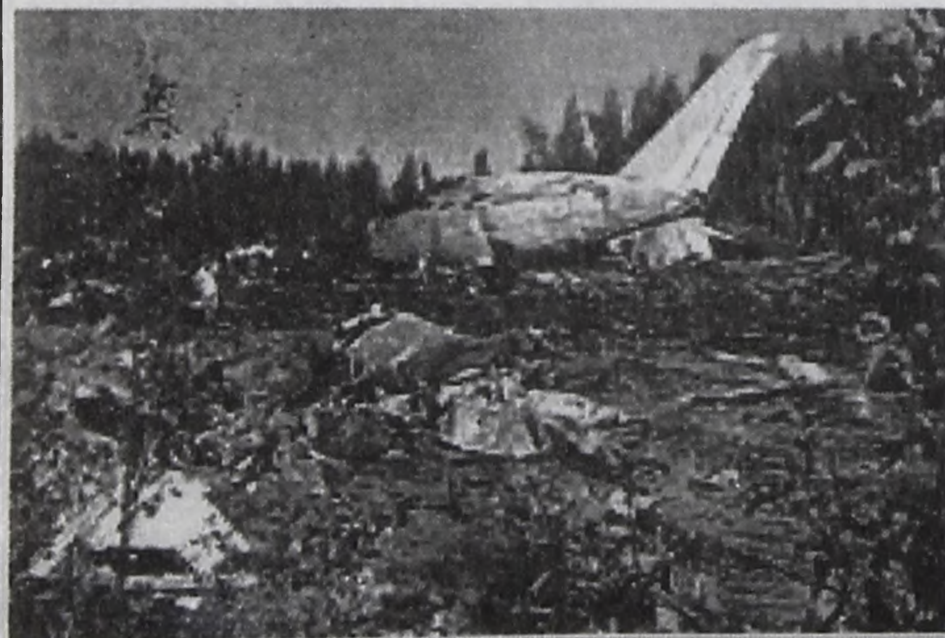
28 июля. Авиакатастрофа под Москвой.