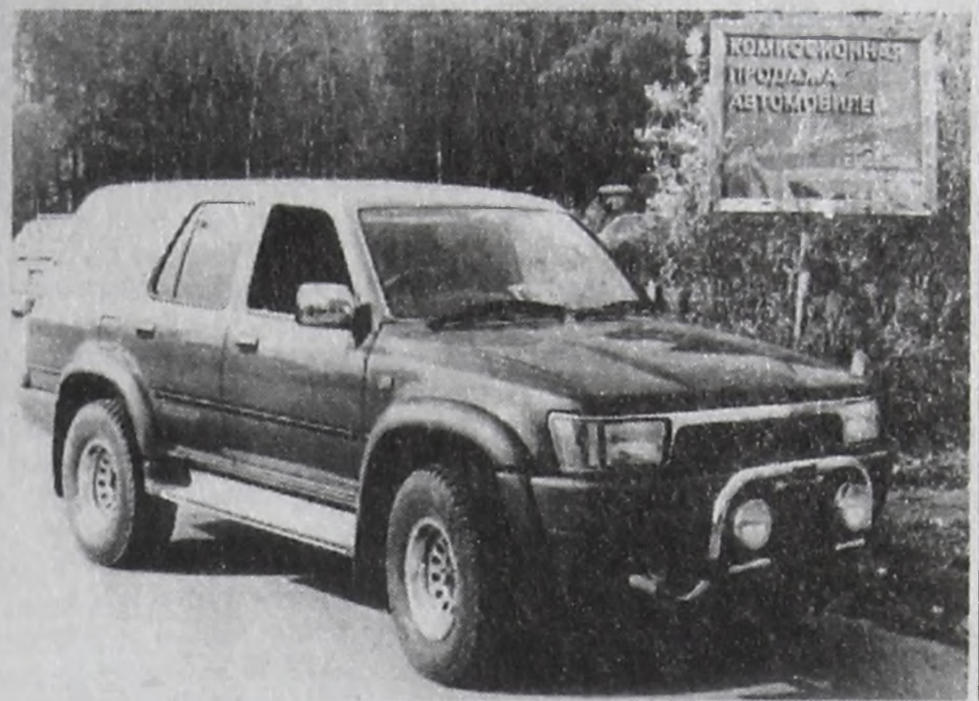
нако после подписания документа до реального подорожания машин пройдет не меньше года. ("АиФ")

В ближайшие дни в правительстве будет подписана концепция развития автотропа. Этот документ разрабатывают еще с зимы. Его несколько раз переделывали, и, если он все же будет подписан (а сомневаться в этом не приходится), ставка на иномарки от трех до семи лет, а также на те типы машин, производство которых осваивается в России, составит 35%. Пошлина на автомобили старше семи лет увеличится в 3-4 раза в зависимости от объема двигателя. Таким образом, семилетняя машина с двигателем 2,5 литра подорожает на 4 тыс. долл., а с 3-литровым движком - на 6250 долл. Авторы концепции рассчитывают снизить ввоз старых иномарок втрое. Од-