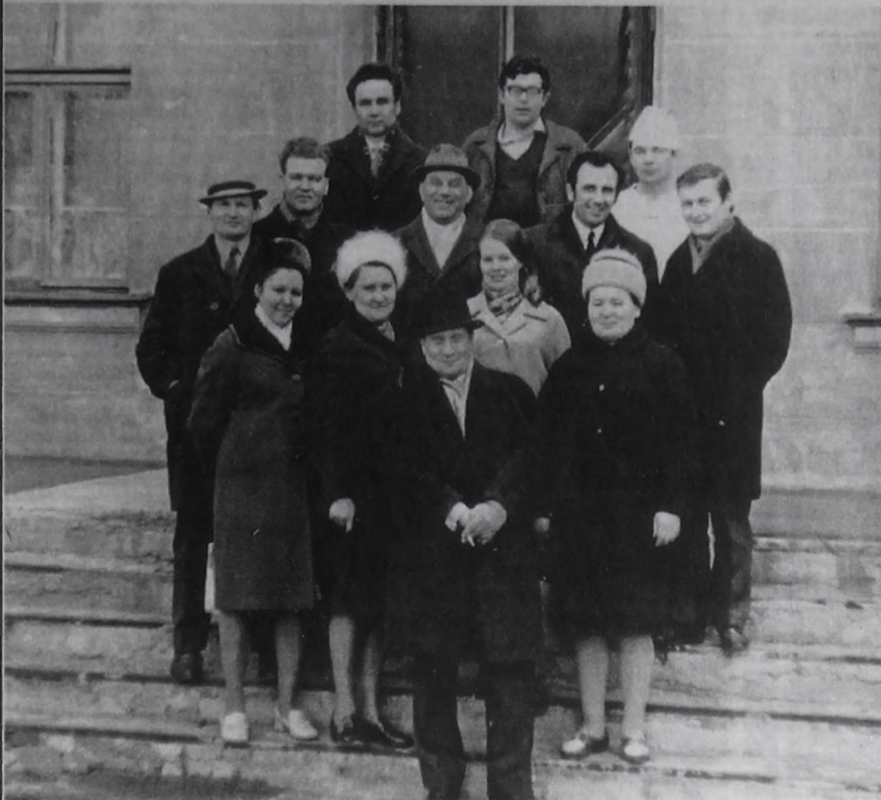
Фотография из 50-х.

САМОЙ ИЗВЕСТНОЙ БОЛЬНИЦЕ В ГОРОДЕ СКОРО БУДЕТ 50. ВРЕМЯ ГОТОВИТЬ ПОДАРКИ