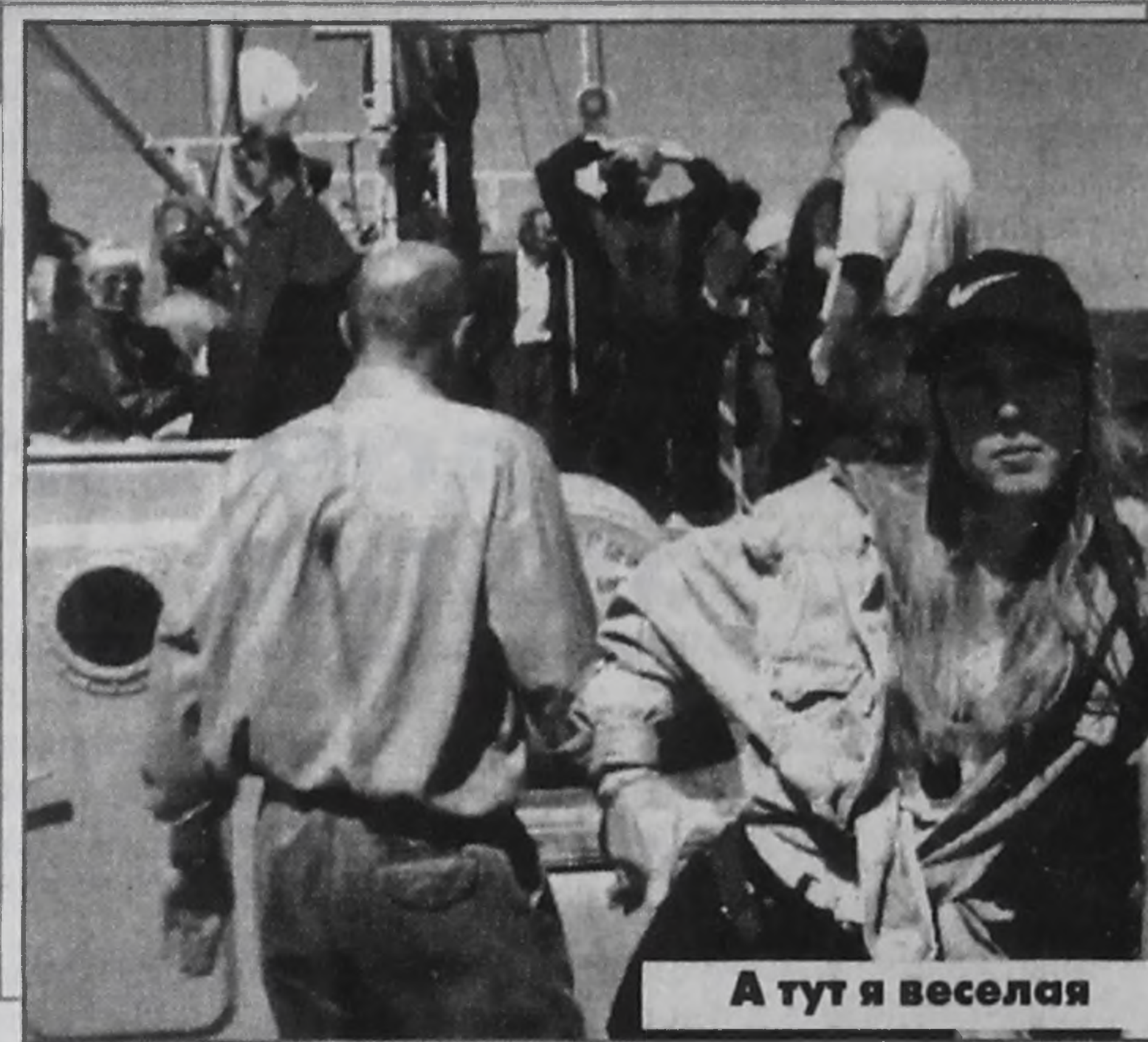
А тут я веселая