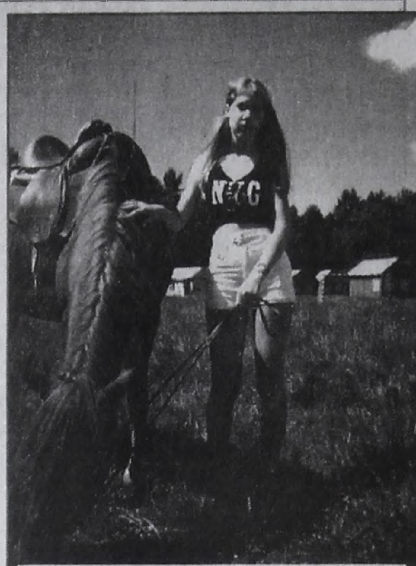
Он согласился со мной поскучать