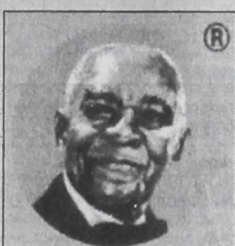
Форрест Марс сделал все возможное, чтобы никто не знал, как он выглядит. Зато он увековечил образ совсем не похожего на себя дядюшки Бена