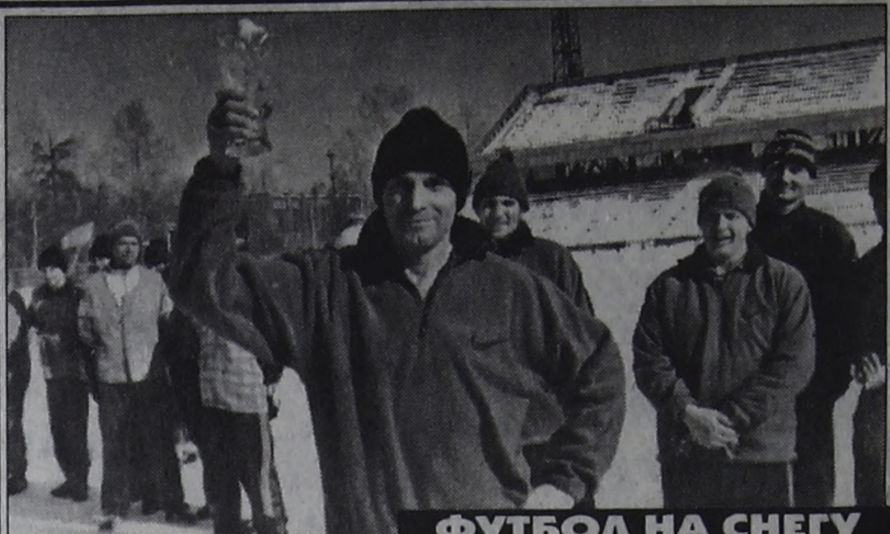
ФУТБОЛ НА СНЕГУ