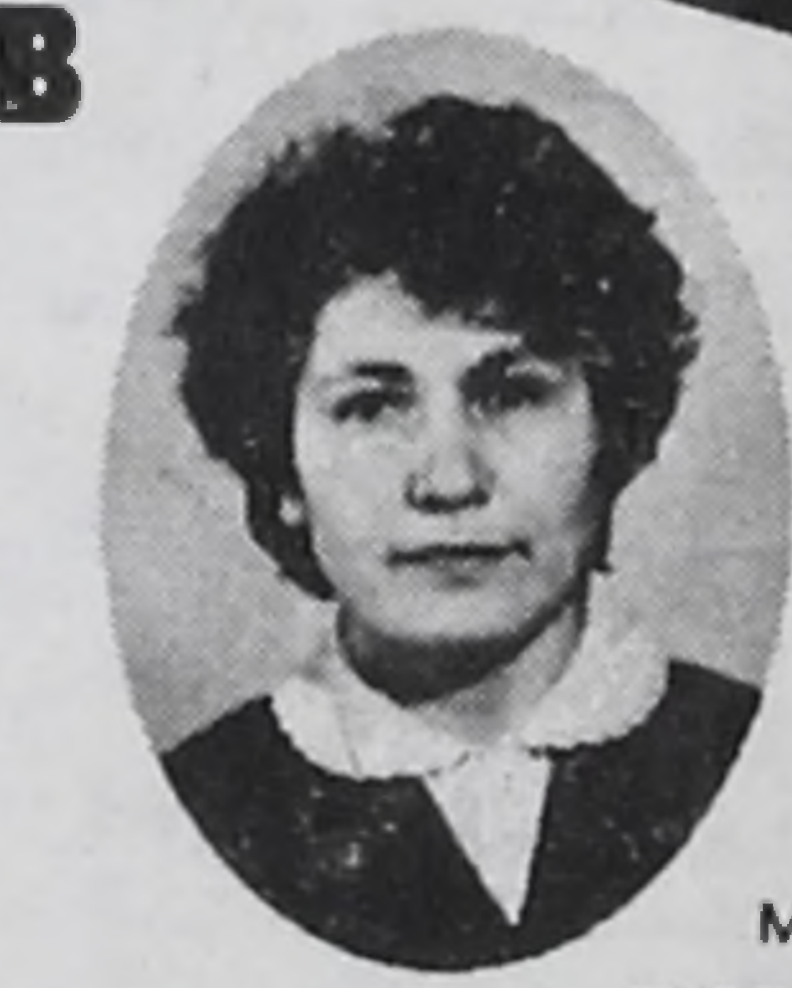
мор- ская водица

Когда он открыл банку... там оказалась одна