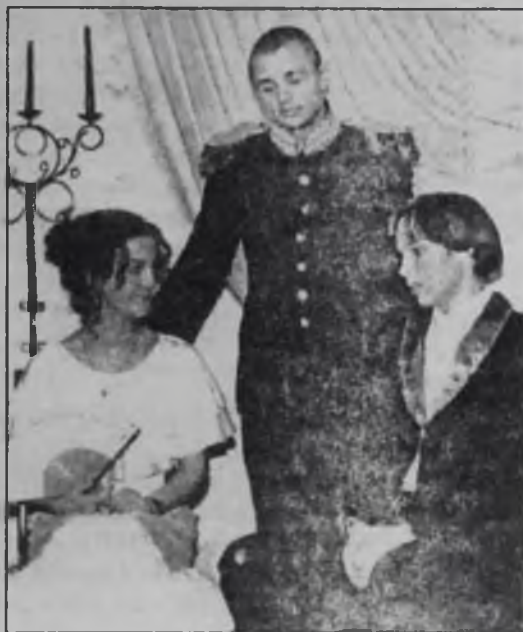
исполняется 161 год со дня смерти поэта.