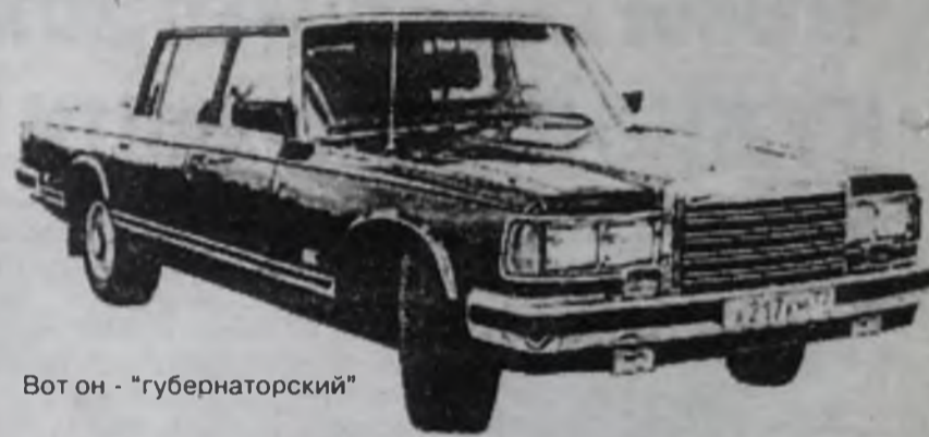
Вот он - "губернаторский"

Российский чиновник в личных удобствах толк знает. В будущем году планируется собрать 18 новых "губернаторских" зилков. Так что губернаторы будут и при комфорте и национальному "патриотизму" не изменят.