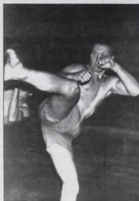
ган» (дир. А.Щербakov).