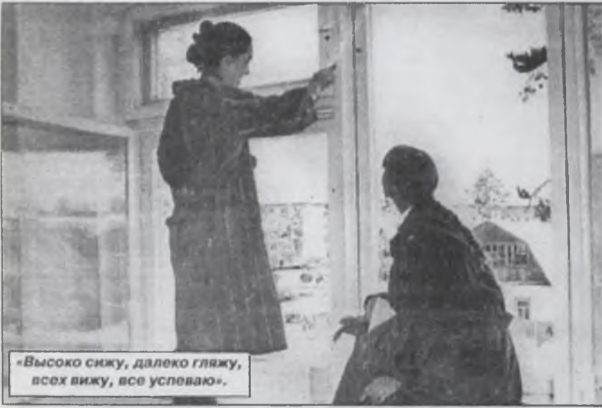
«Высоко сижу, далеко гляжу, всех вижу, все успеваю».

назвали ребята свою площадку) нас поджидали «Мышкиноручки», «Лисята», «Зайчики-попрыгайки», которые исполнили нам свою любимую песню «Горох».