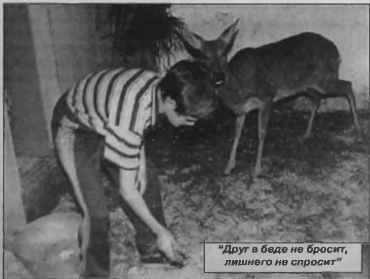
"Друг в беде не бросит, лишнего не спросит"