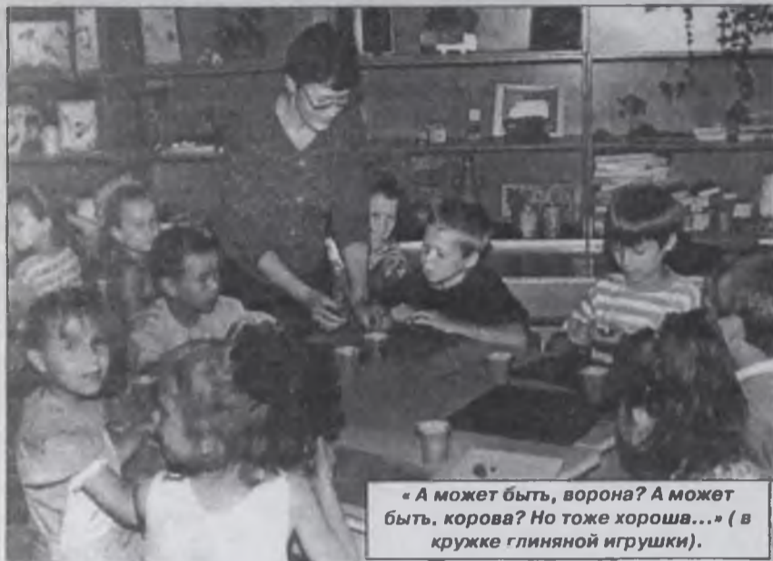
«А может быть, ворона? А может быть, корова? Но тоже хороша...» (в кружке глиняной игрушки).