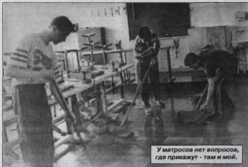
У матросов нет вопросов, где прикажут - там и мой.