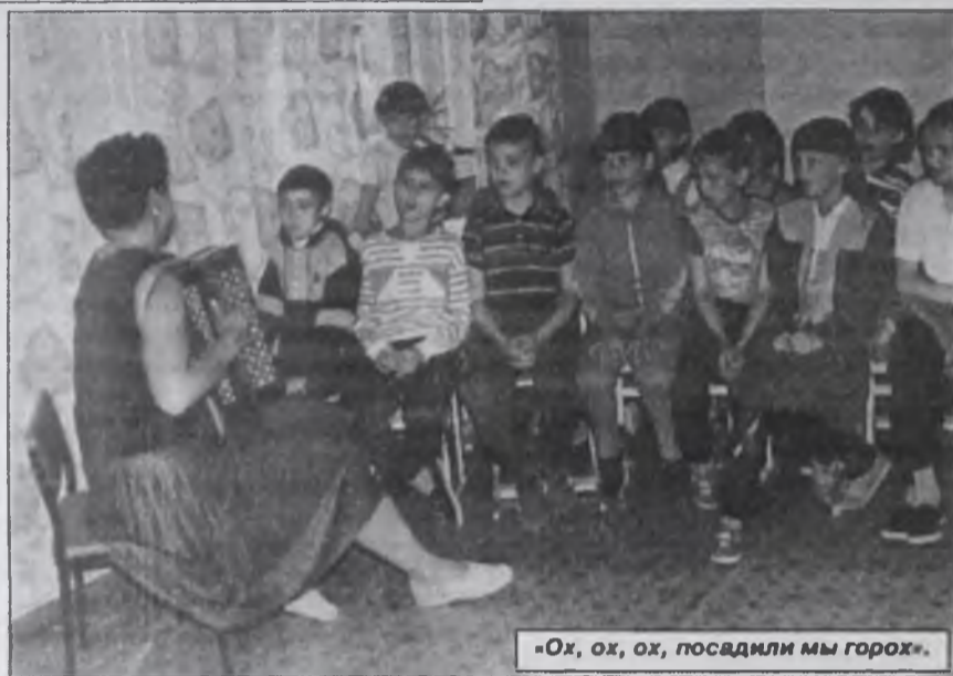
«Ох, ох, ох, посадили мы горох».

Такая же история и с лагерем дневного пребывания в школе №4. Сезон был первым и последним. И, может быть, потому дети отдыхали здесь на полную катушку. Пели, соревновались, ходили в бассейн и на экскурсии, смотрели мультики, спектакли, цирковые программы и веселились, в общем, находили себе массу занятий, отвлекающих их от скуки. В «Теремке» (так