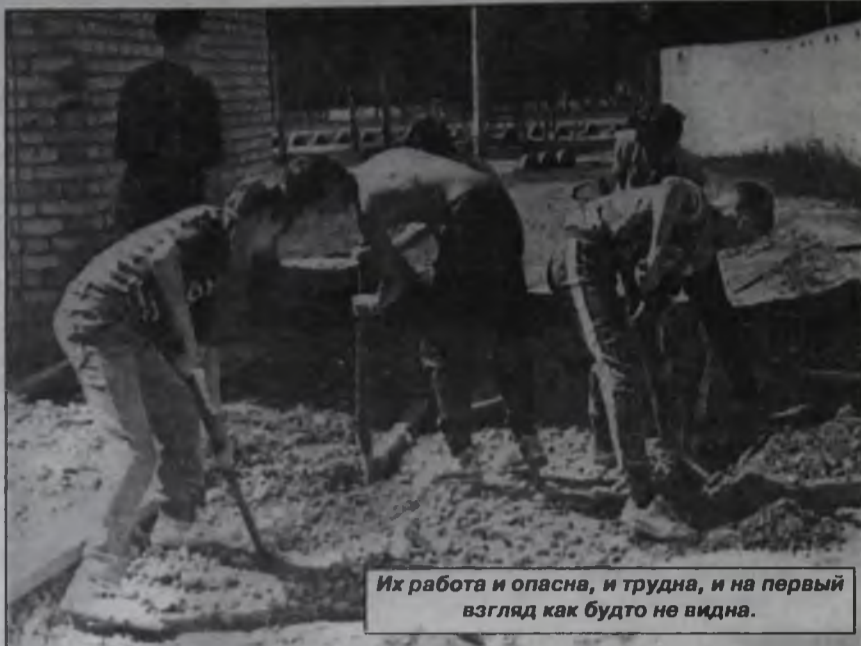
Их работа и опасна, и трудна, и на первый взгляд как будто не видна.

На этой площадке отдыхали в основном младшие школьники 8-11 лет из семей