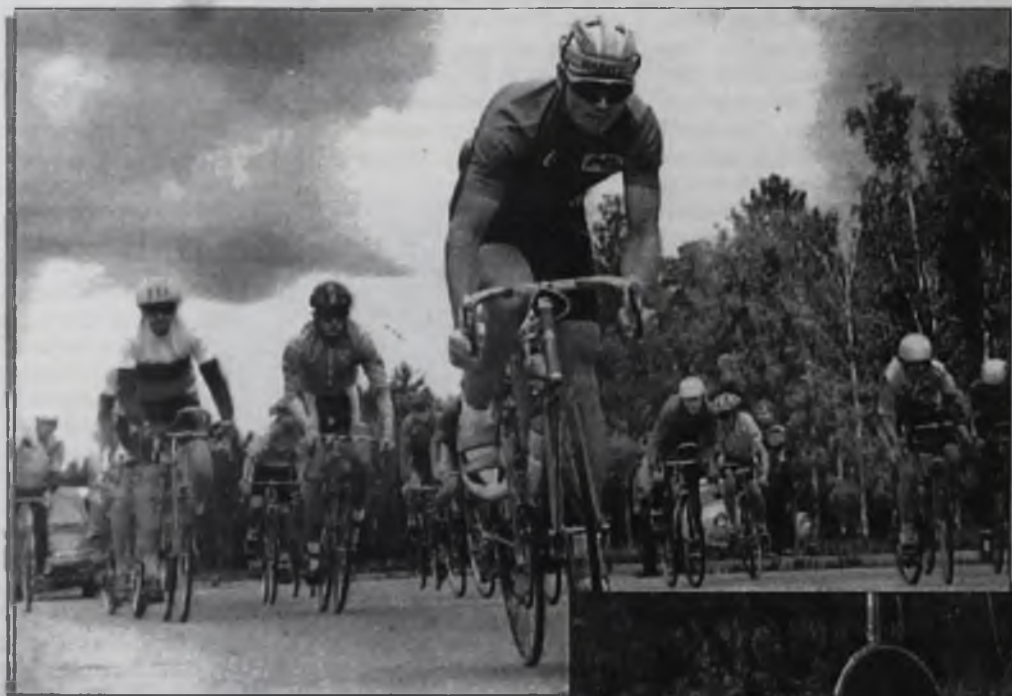
велосипедисты держат скорость в среднем до 50 километров в час, а на финише она увеличивается до 60 и более.

Время старта. Вперед вырывается тренерский "жигуленок" с маячком. За ним, после отмашки, группа спортсменов младшего возраста, следом машины сопровождения, "технички". В общем все соревнования вылились в праздник страстей и скорости. Оказывается, по трассе