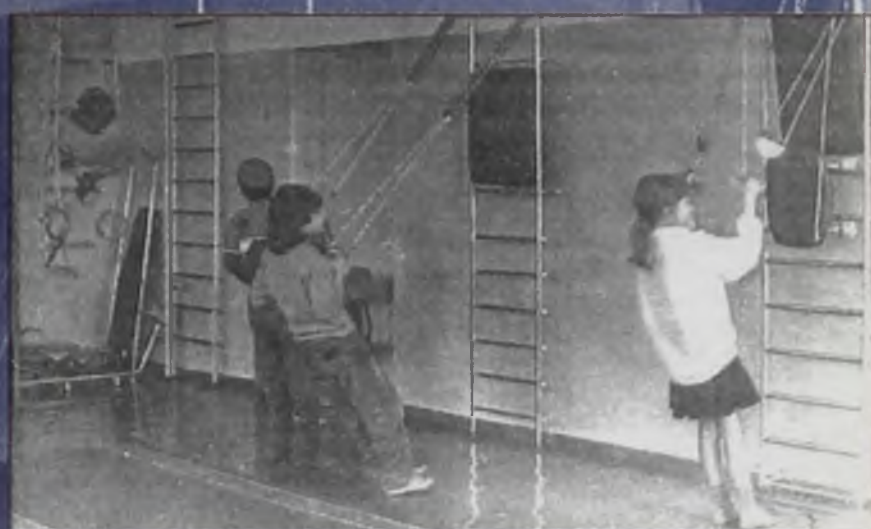
А так - больные дети в единственной в Ангарске лесной школе.