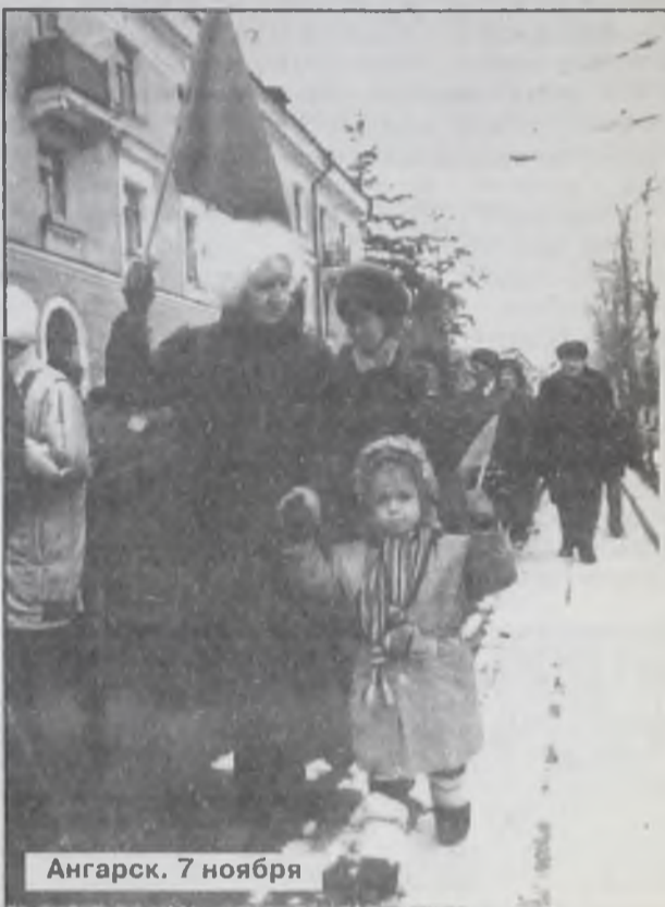
Ангарск. 7 ноября

«Время» — «Диана» — «Время». Среда, с 17 до 19 часов, малый зал ДК нефтехимиков.