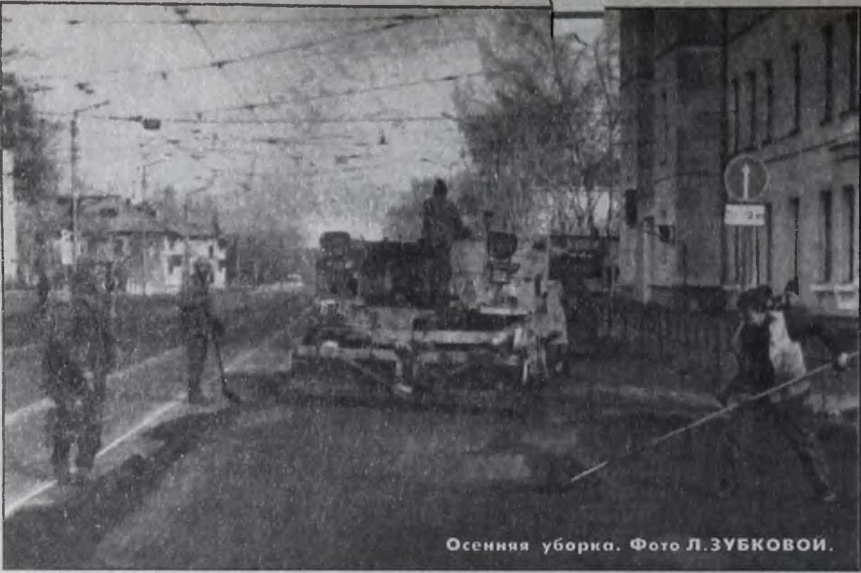
Осенняя уборка.