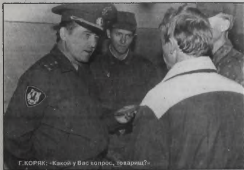
Г. КОРЯК: «Какой у Вас вопрос, товарищ?»