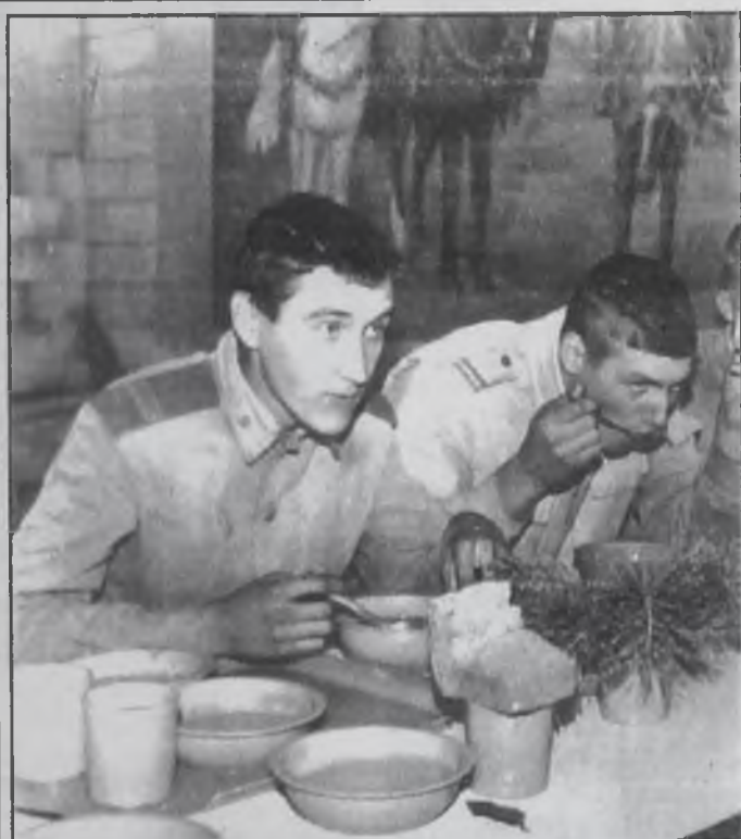
Родительский день в «учебке» под Ангарском. Матерей, конечно, больше всего волнует вопрос, будут ли их детей отправлять в Чечню. (Читайте на 7-й стр.)

В связи с дополнительной платой почте за пользование абонентскими ящиками цена подписки для вас с 12 октября будет 46800 рублей.