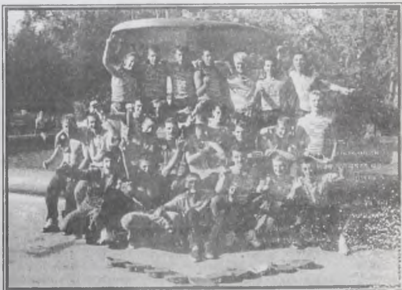
На снимке: 2 августа 95-го. День ВДВ. Ангарск.

Ангарчане, десантники разных годов призыва, собираются у ДК нефтехимиков. Вспоминают плечами у многих Афган, а теперь вот Чечня.