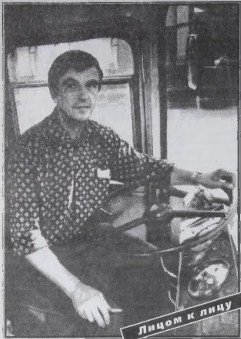
Лицом к лицу

В начале прошлого месяца из Ангарска в дальневосточный город Приаргунск ездил необычная колонна, состоящая из трёх автобусов и трёх грузовых машин. Этот караван был специально экипирован ангарскими строителями для того, чтобы доставить в город китайских строителей. Привезли 61 рабочего с необходимым скарбом, инструментом и даже собственным продовольствием.