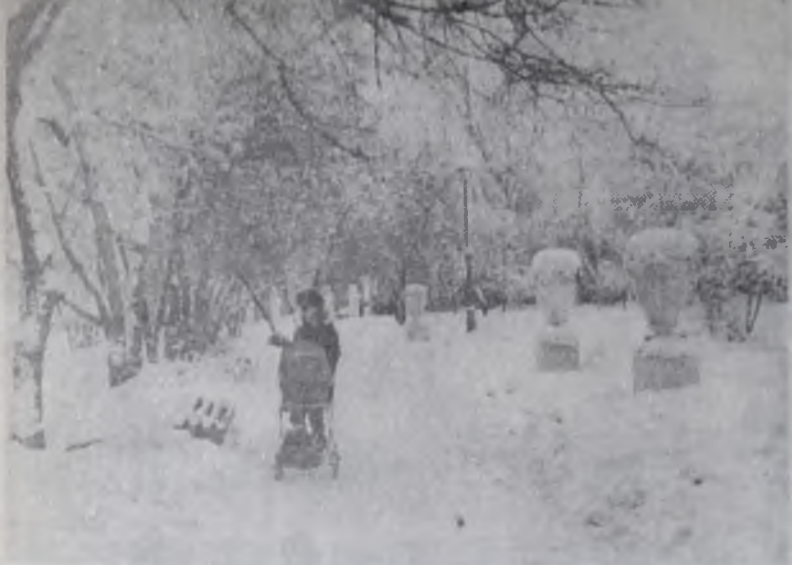
В зимнем парке.