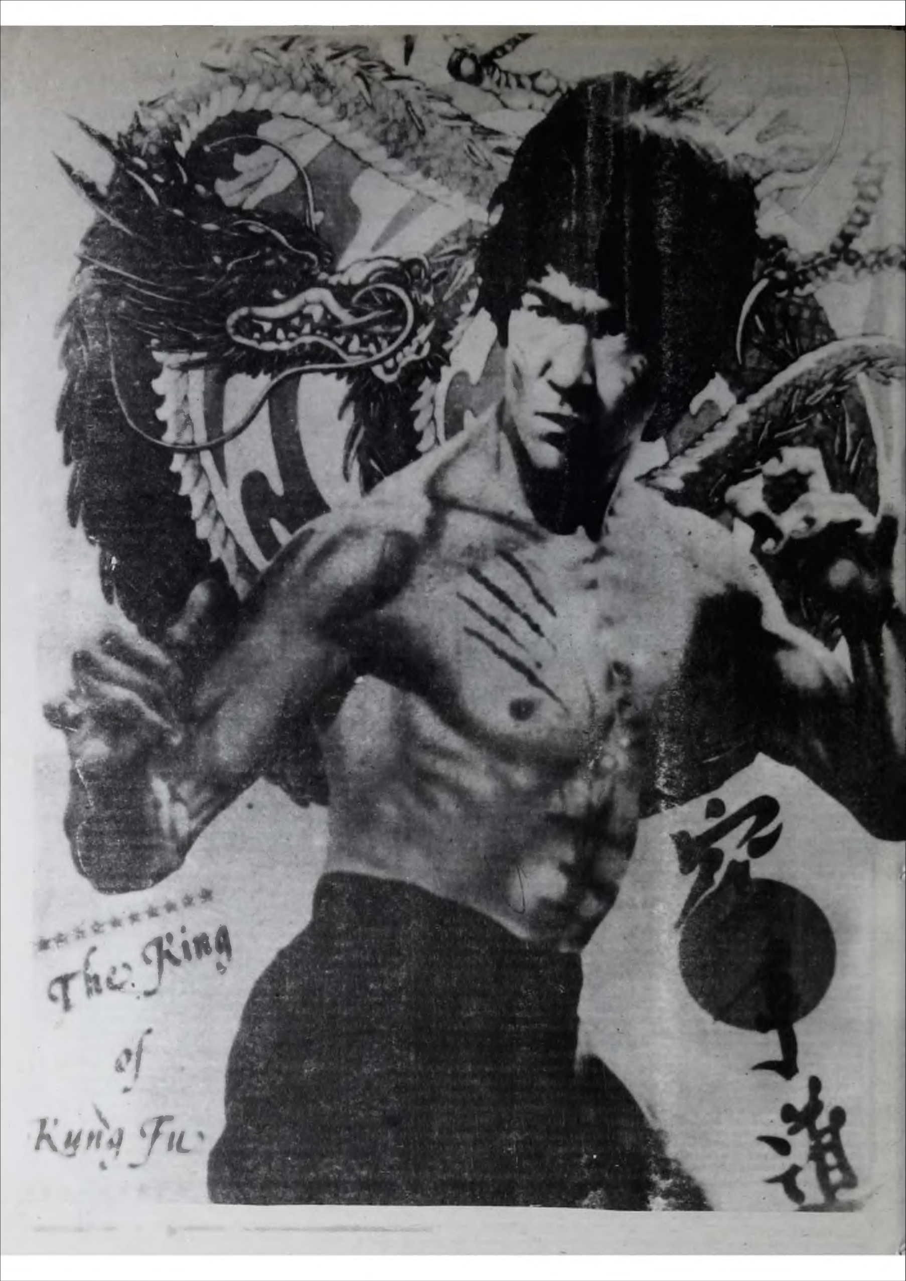
***** The King of Kung Fu