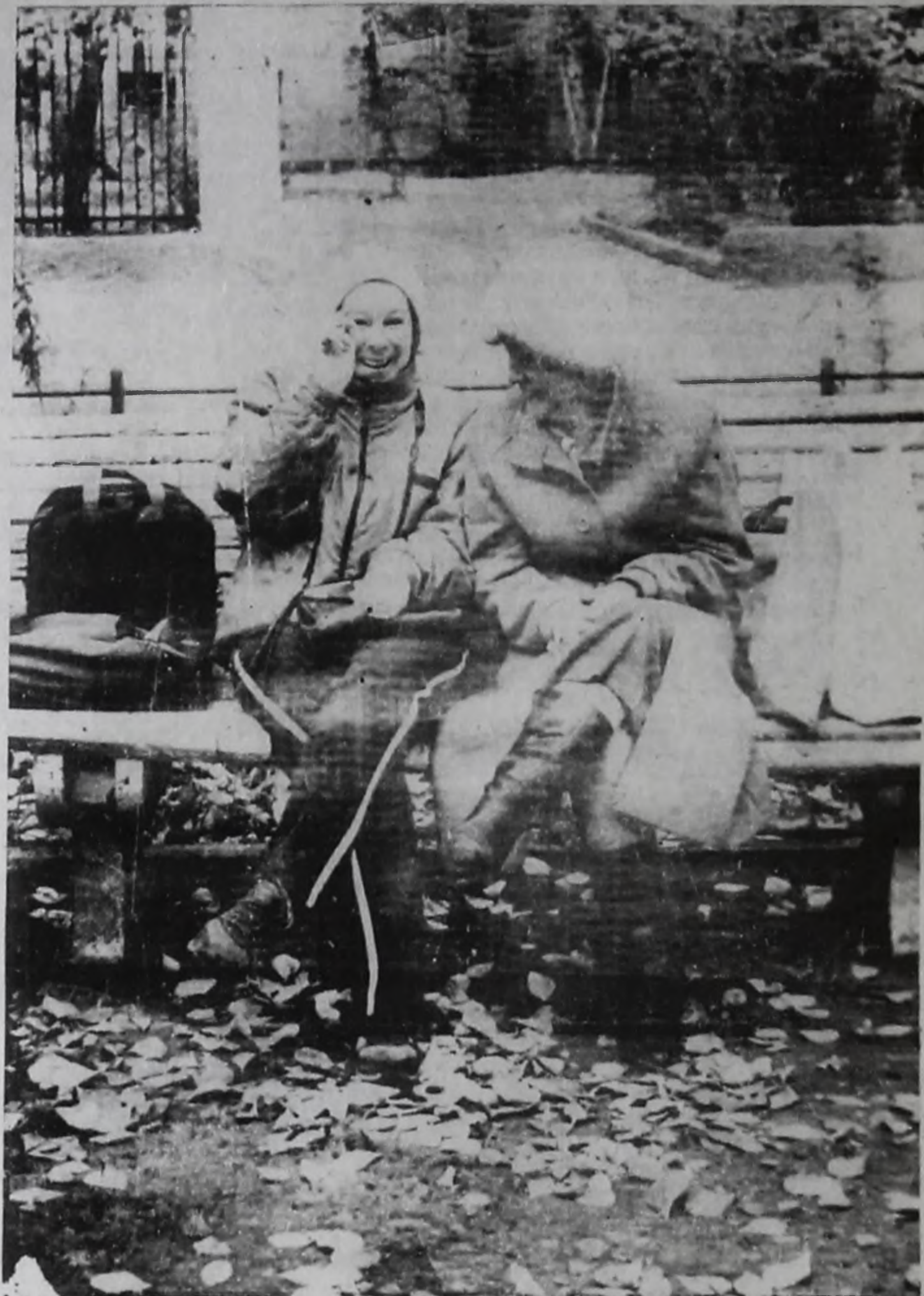
Уж осень на дворе.