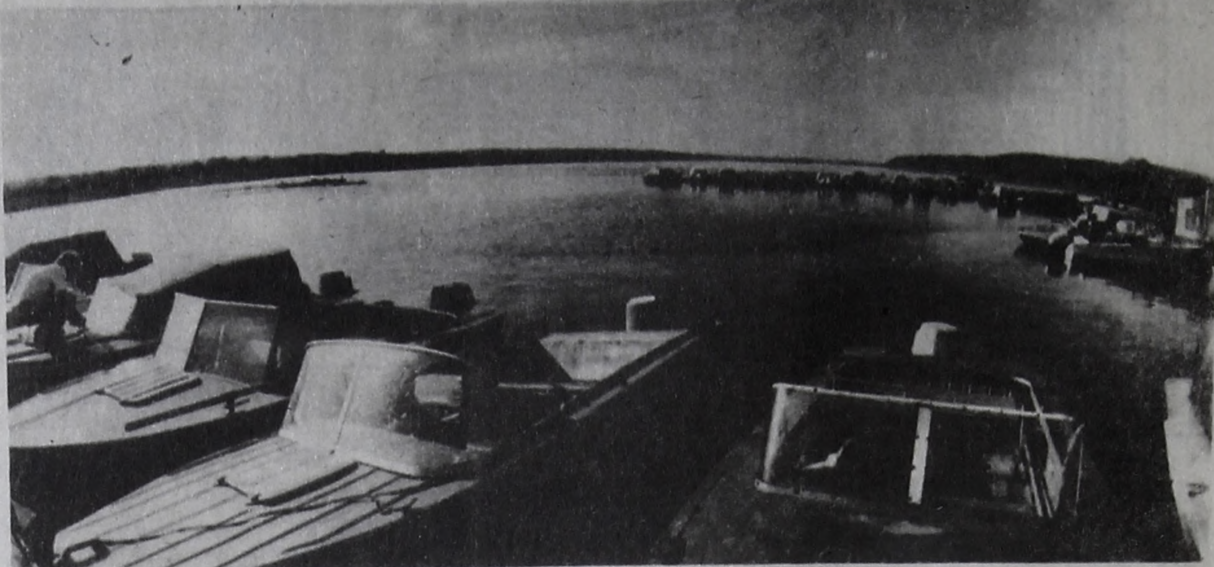
Лето. На Ангаре.