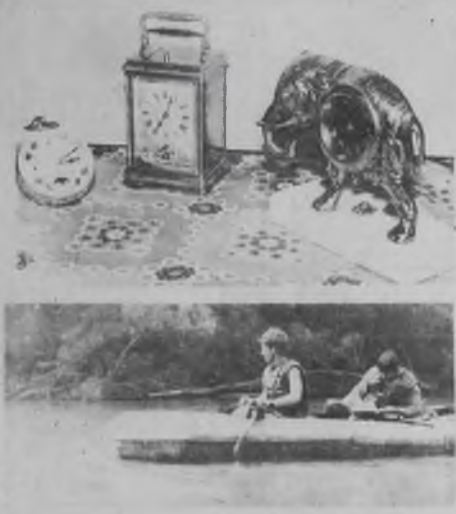
Фотовернисаж Анатолия Графова

Б. ВАСМАНОВ, главный врач горбольницы N 1, народный депутат.