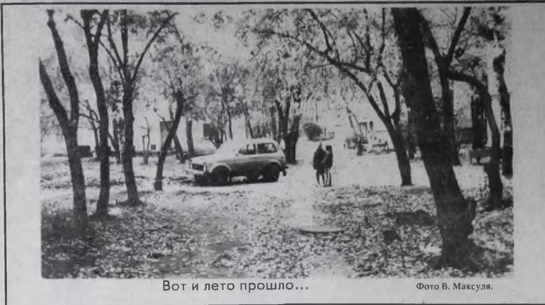
Вот и лето прошло...