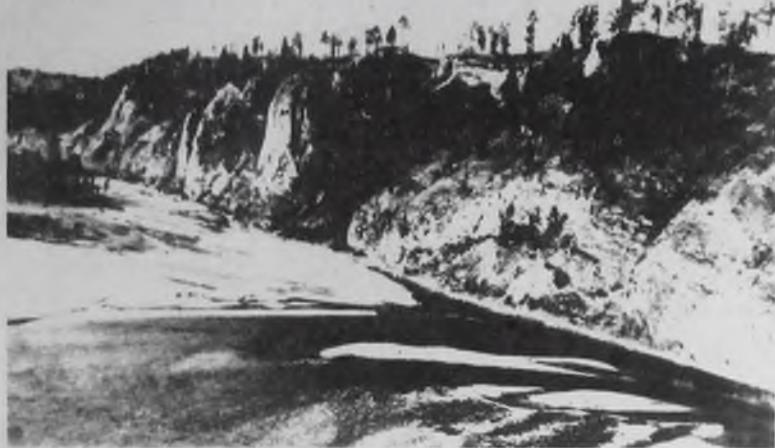
Край наш сибирский.