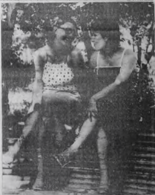
Хорошо просто посидеть в знойный летний день под тенью деревьев. Хорошо поболтать беззаботно с любимой подружкой. Не все же о хлебе насущном, о нерешенных проблемах, о трудностях, о ценах и о зарплате.

Заполнение месячных клеток при переадресовании издания, а также клетки "ПВ-МЕСТО" производится работниками предприятий связи и Союзпечати.